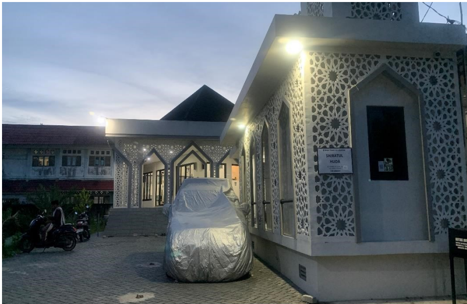
Gambar 4.1 Tempat Rumah Tahfidz Al-Qur'an di Musholla Shiratul Huda