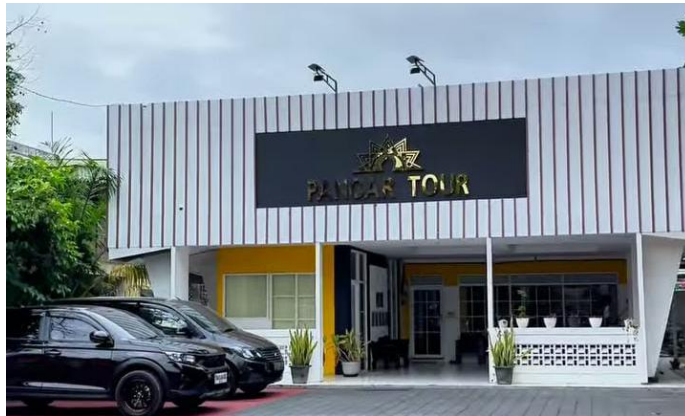
Gambar 4.1 Kantor PT. Pancar Ni'mah