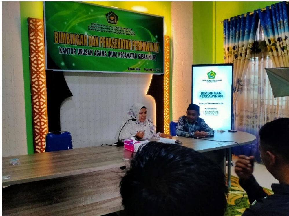
Foto. 4 Praktisi dan peneliti sebelum pelaksanaan Pelatihan Pranikah di KUA Kecamatan Kusan Hilir Pagatan