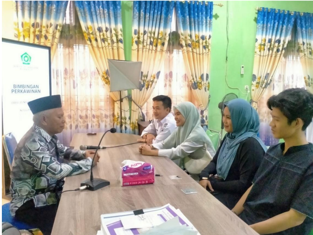
Foto. 6. Praktisi dan Peserta Pelatihan Mengikuti Penasehatan sebelum Pelaksanaan Pelatihan Pranikah