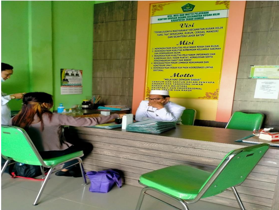
Foto. 1 Pemeriksaan Berkas untuk memastikan peserta adalah Bersuku Bugis