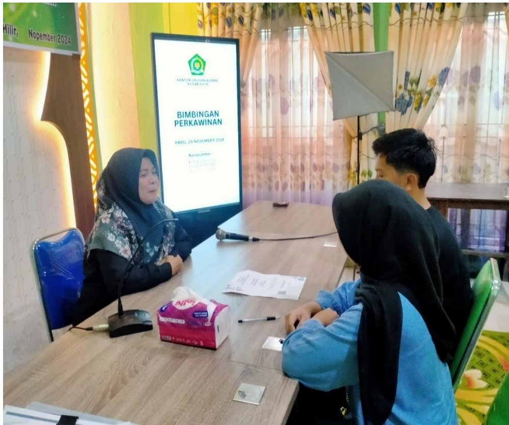
Foto 2. Peserta sedang menerima arahan untuk mengikuti Pelatihan Pranikah