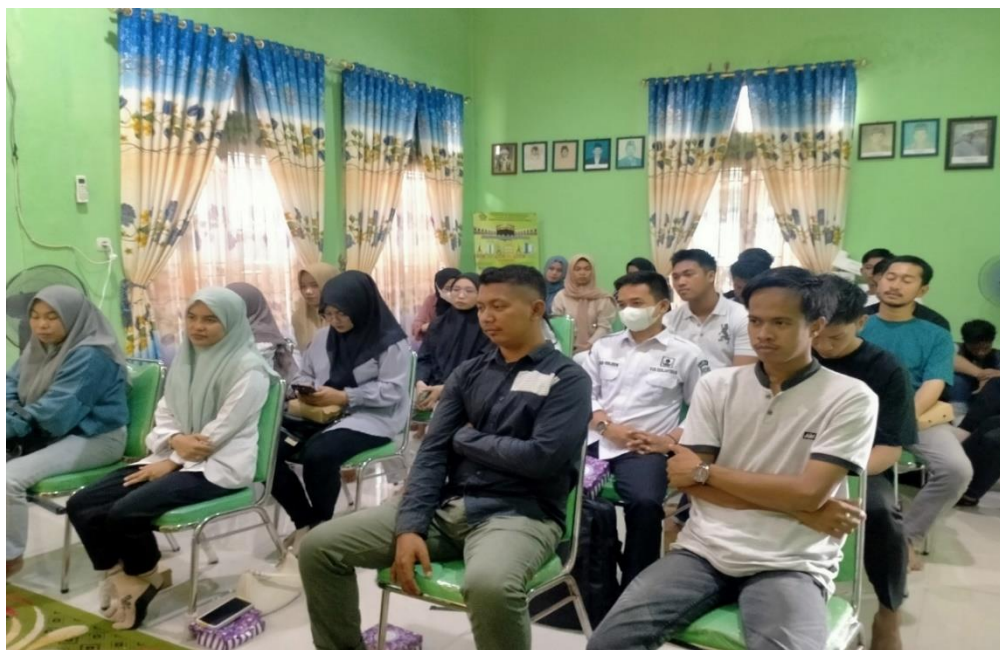
Foto. 5 Peserta mengikuti pelatihan Pranikah Berbasis Kearifan Lokal Budaya Bugis Pagatan Tanah Bumbu. Di Kecamatan Kusan Hilir Pagatan