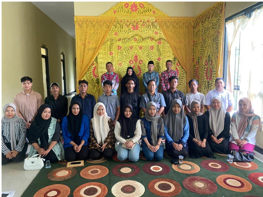
Foto. 7. Peserta Pranikah setelah Pelatihan Pranikah di KUA Kecamatan Batulicin