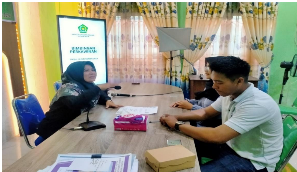
Foto 3. Peserta sedang menerima arahan untuk mengikuti Pelatihan Pranikah