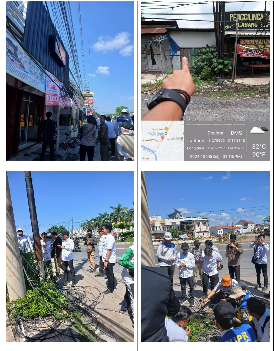
Gambar 4.3 Temuan Lapangan Kabel Tidak Beraturan di Ruas Jalan Handil Bakti