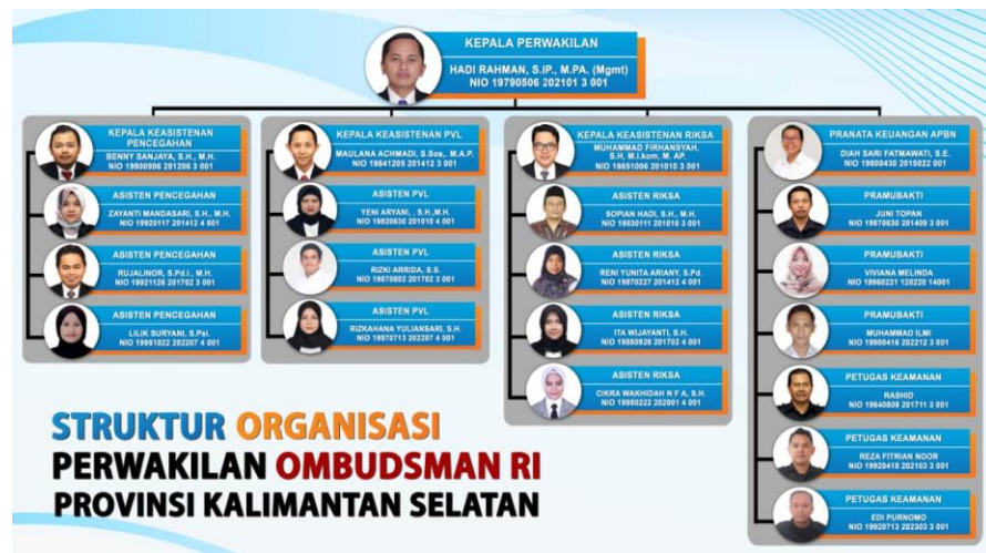
Gambar 4.1 Struktur Organisasi Ombudsman RI Perwakilan Kalimantan Selatan