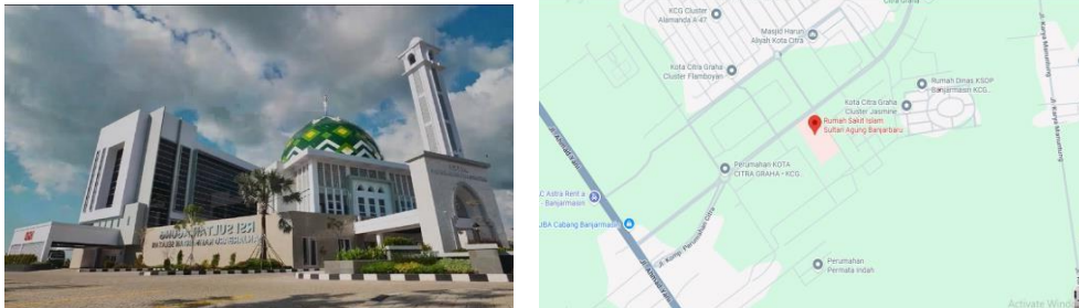
Gambar 4.1 Lokasi Penelitian RSI Sultan Agung Banjarbaru