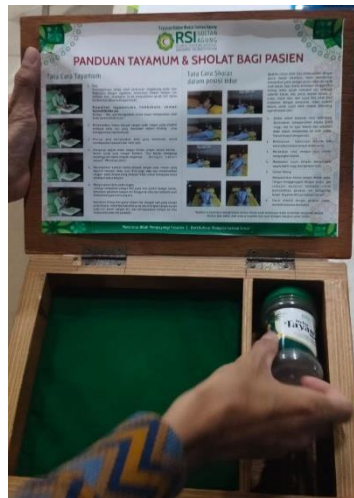
Gambar 4.7 Tempat Dan Pasir Nya Untuk Bertayamum Beserta Panduan Bertayamum Bagi Pasien Yang Tidak Bisa Berwudhu