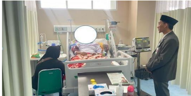
Gambar 4.6 Proses Bimbingan Rohani Islam oleh Petugas Rohani Islam