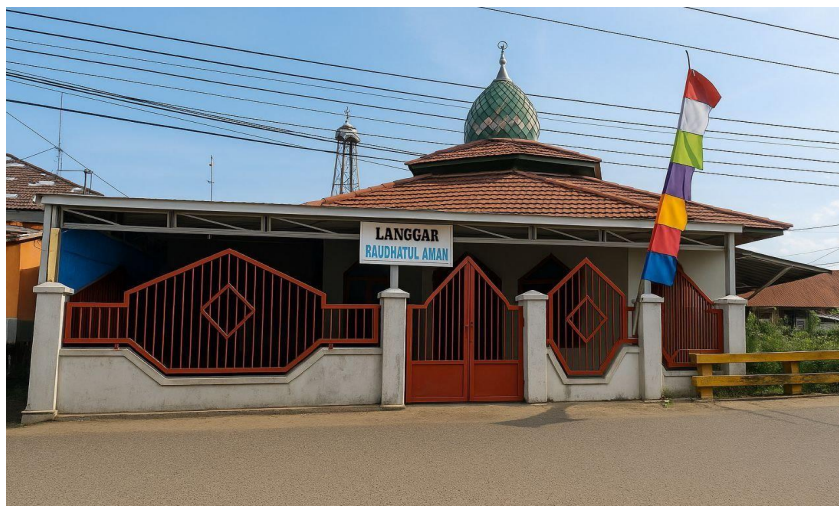
Gambar 4.2 tempat Mushola Raudhatul Aman