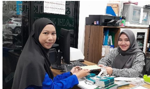
Penyerahan Surat Riset Di Kantor Perwakilan Pt. Kamilah Berkat Guru