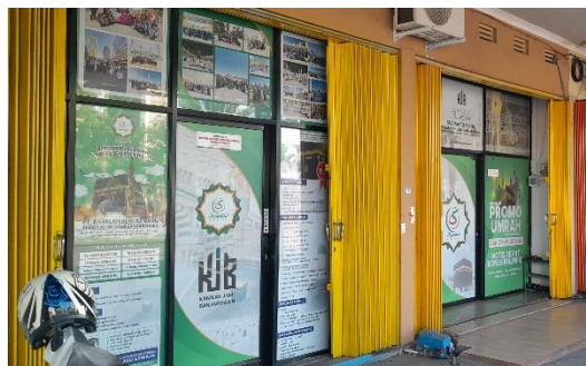
Lokasi Kantor Perwakilan Kamilah Berkat Guru Seberang Mesjid Jami