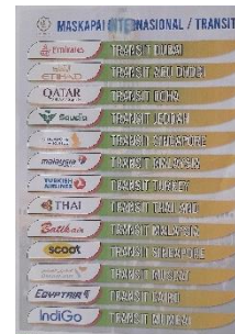
Brosur Beberapa Maskapai Internasional Yang Dipakai