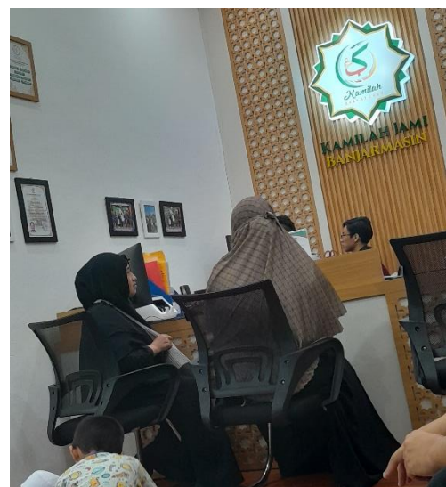
Karyawan Melayani Jemaah Di Kantor Perwakilan Pt. Kamilah Berkat Guru