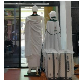
Atribut Perlengkapan Jemaah untuk Ibadah Umrah