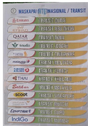
Gambar 4.4 Daftar Maskapai Internasional Yang Digunakan Oleh PT. Kamilah Berkat Guru Banjarmasin untuk Keberangkatan Jemaah Umrah.