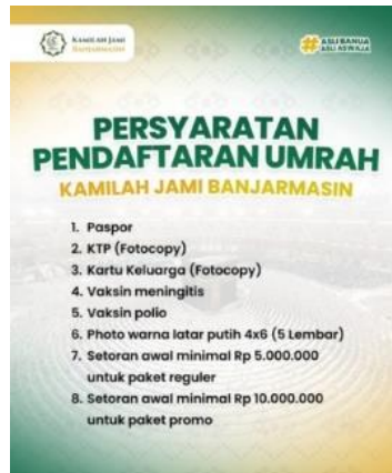
Gambar 4.3 Foto Screenshots Persyaratan Pendaftaran Umrah di Media Sosial Kantor Perwakilan PT. Kamilah Berkat Guru Banjarmasin