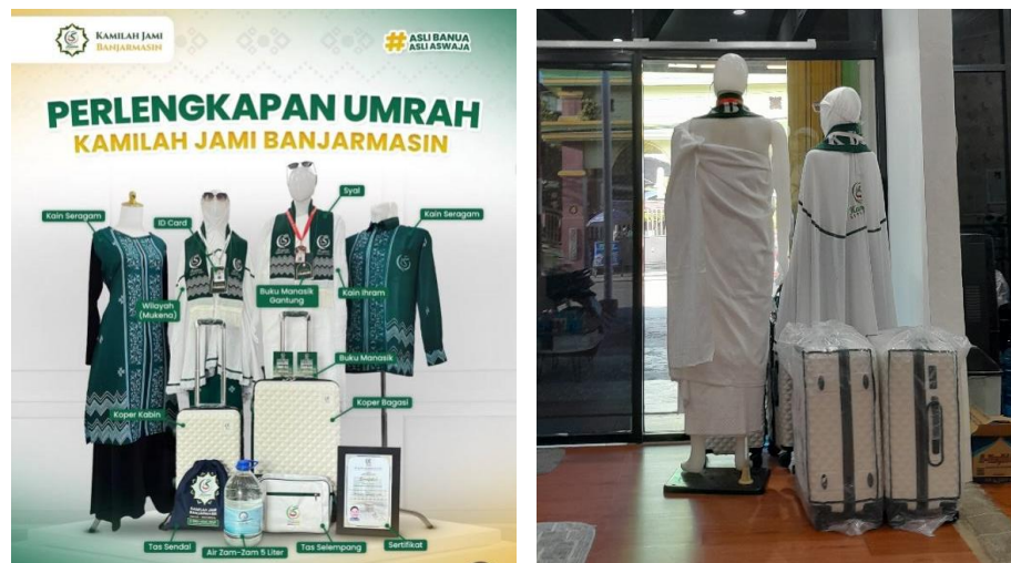
Gambar 4.1 Foto Patung Peraga dan Screenshots Perlengkapan Umrah di Media Sosial Kantor Perwakilan PT. Kamilah Berkat Guru Banjarmasin