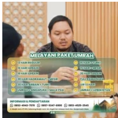
Perwakilan PT. Kamilah Berkat Guru