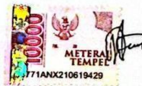
Nur Halimah Fitria