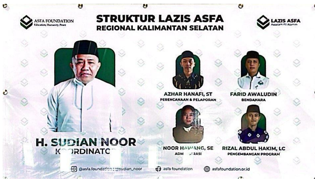
Gambar 4. 2 Struktur Pengurus Lazis As-salam Fil Alamin Kalimantan Selatan

Sebagai salah satu cabang dari Lazis As-salam Fil Alamin Kalimantan Selatan, lembaga ini berada di bawah pembinaan dan arahan pusat, namun tetap memiliki status otonom dalam hal pengelolaan dana zakat di wilayah Kalimantan Selatan. Struktur organisasi merupakan representasi hubungan fungsional antar bagian dalam lembaga, yang mencerminkan tugas, wewenang, dan tanggung jawab masing-masing unsur dalam menjalankan peran kelembagaan. Struktur kepengurusan Lembaga Amil Zakat Infaq Shadaqah Lazis As-Salam Fil Alamin Kalimantan Selatan terdiri atas beberapa posisi utama, yaitu: