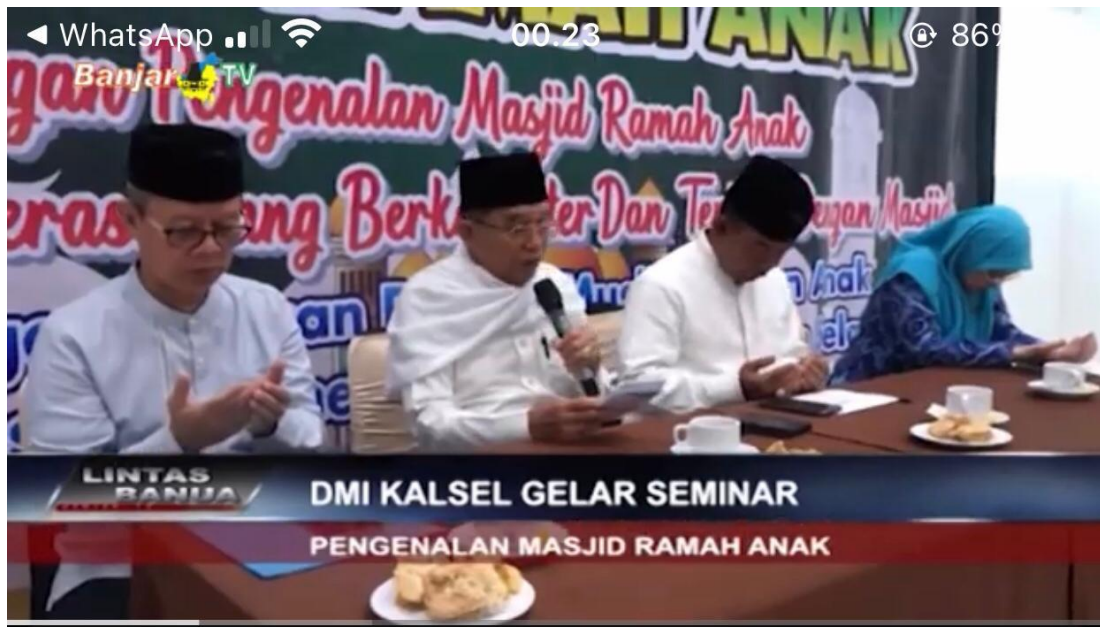
Gambar 4. 2 Seminar Pengenalan Masjid Ramah Anak