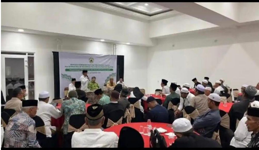
Gambar 4. 1 Seminar pengembangan ekonomi umat dan wisata religi berbasis masjid