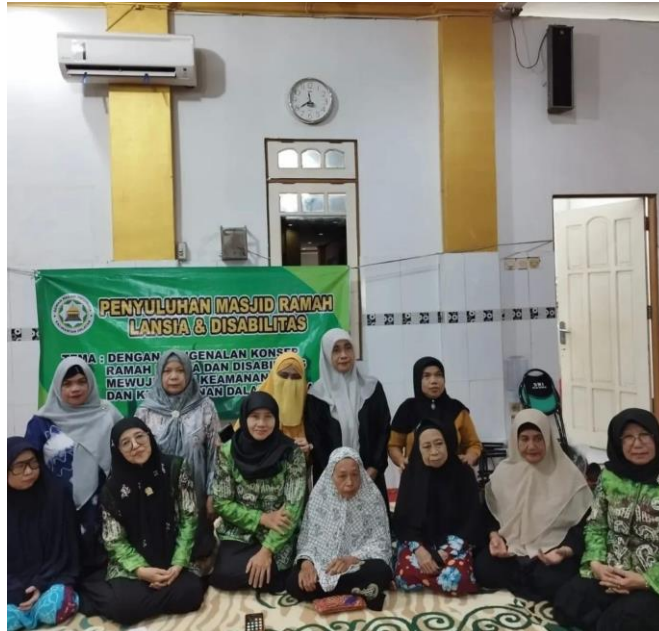
Gambar 4.4 Masjid Ramah Lansia dan Disabilitas

Sumber: https://www.instagram.com/p/DNz9O9s3tUf/?img_index=1&igsh=MXdsa3hcnNkMGdxeg==