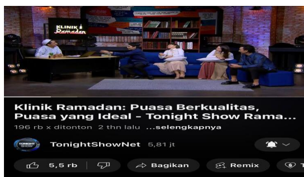
Gambar 1. 1 Klinik Ramadan

Sama seperti banyak program televisi di Indonesia lainnya, saat bulan Ramadan tiba, program-program khusus yang berhubungan dengan tema Ramadan pasti akan menghiasi layar kaca. Ini termasuk acara sahur dan buka puasa yang menjadi langganan setiap tahun. Bahkan "Tonight Show" pun tak mau ketinggalan untuk meramaikan semarak bulan Ramadan ini. Mereka menghadirkan segmen menarik bernama "Klinik Ramadan" di dalam acaranya, dengan mengundang Habib Husein Ja'far Al Hadar