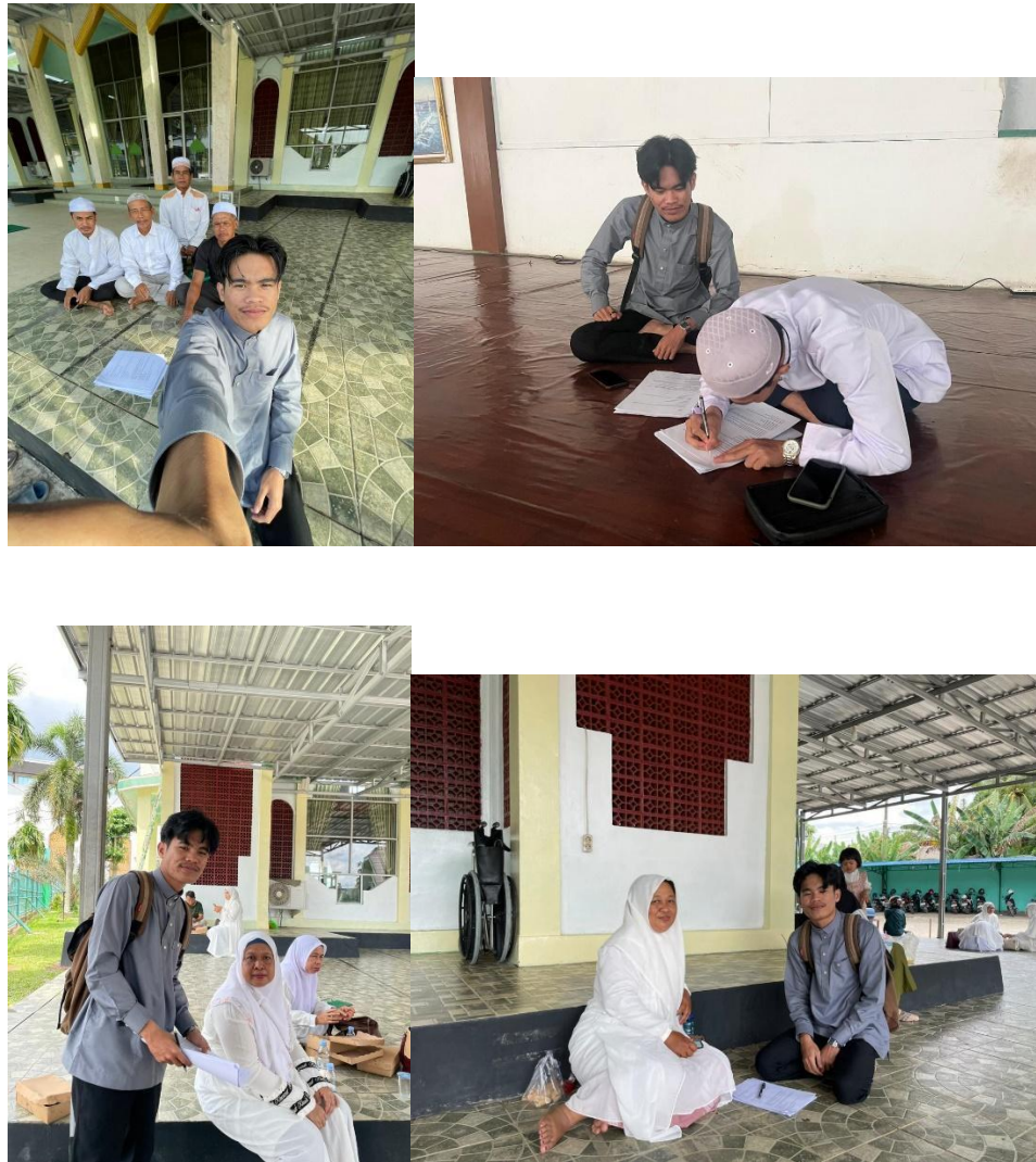
Gambar 2 Dokumentasi Pen Jawaban Soal