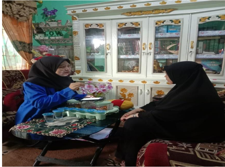
Foto bersama dengan Jemaah Haji Kota Banjarbaru Tahun 2024