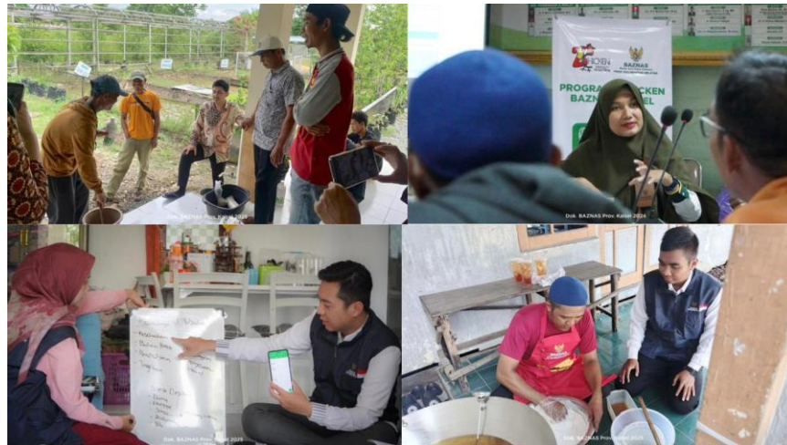
Gambar 4.6 Pendampingan dari Bidang Pendayagunaan