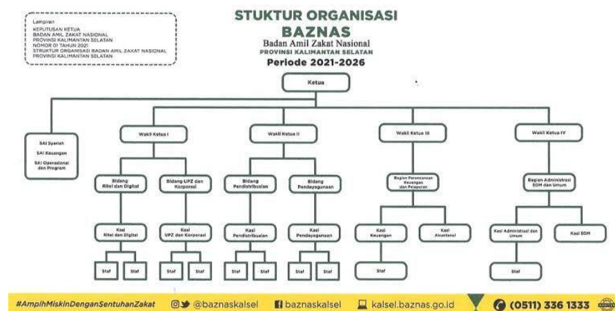
Gambar 4.1 Struktur Organisasi BAZNAS Provinsi Kalimantan Selatan periode 2021-2026