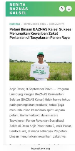
Gambar 4.5 Petani dari Program Lumbung Pangan Berzakat

dengan pendampingan tepat waktu turut mendukung keberhasilan program ekonomi pedesaan.