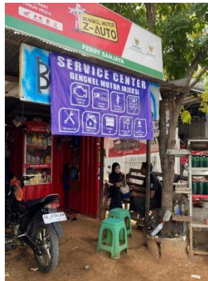
Gambar 4.4 Rombong Bengkel Z-Auto

Pernyataan tersebut menunjukkan bahwa kecepatan penyaluran dana zakat memberikan dampak langsung terhadap keberlangsungan usaha mustahik, terutama dalam kondisi mendesak yang membutuhkan dukungan modal usaha secara cepat.