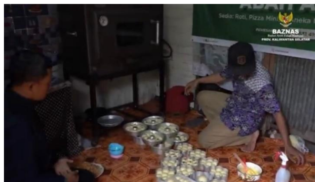
Gambar 4.3 monitoring mustahik micropreneur