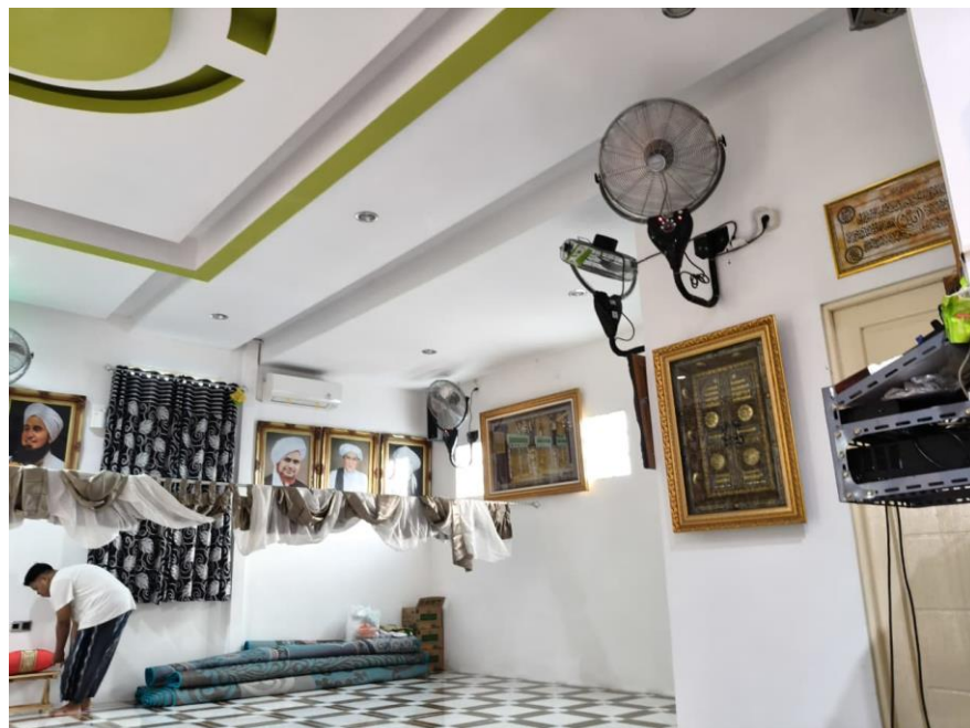
Gambar 4. 2 Tempat Majelis Ta'lim Al-Ghufran Kota Banjarmasin

Pada awalnya, sekitar bulan Ramadhan tahun 2023, pada tepatnya pada tanggal 26 Maret 2023 berlangsung sebuah pembukaan majelis yang