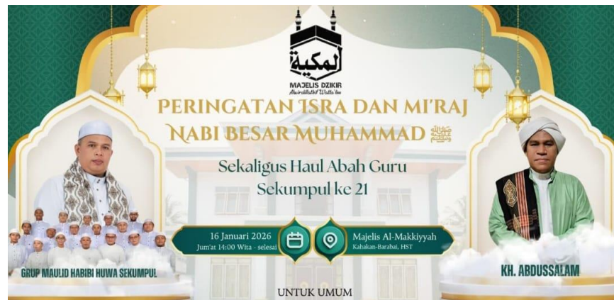
Gambar 4.2 Pamflet Kegiatan Peringatan Hari Besar Islam

Di samping kegiatan rutin, majelis ini turut menyelenggarakan berbagai peringatan Hari Besar Islam (PHBI), seperti peringatan Maulid Nabi Muhammad saw., Isra Mi'raj , serta acara Haulan untuk mengenang dan mendoakan para ulama atau tokoh agama. Kegiatan tersebut biasanya dihadiri oleh jemaah dalam jumlah yang lebih besar dan diisi dengan ceramah keagamaan, pembacaan shalawat, doa bersama, serta kegiatan sosial keagamaan lainnya. Adapun pamflet kegiatan acara peringatan hari besar Islam dapat dilihat sebagai berikut.