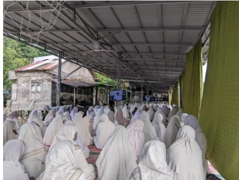
Gambar 4.7 Pelaksanaan Kegiatan Majelis Taklim Al-Makkiyyah