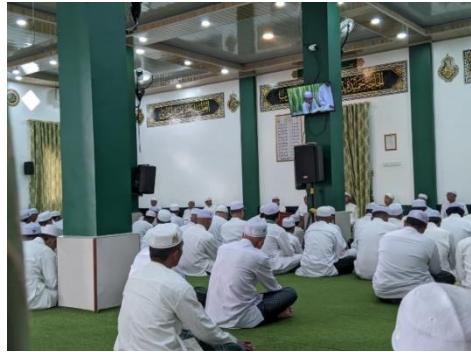
Gambar 4.4 Pelaksanaan Kegiatan Majelis Taklim Al-makkiyyah

Sementara itu, pada pengajian sore Jumat, materi lebih menekankan penguatan iman dan cabang-cabangnya ( syu'abul iman ), yang tercermin dalam amal hati, amal lisan, dan amal perbuatan. Kegiatan ini diawali dengan pembacaan zikir Wirdul Latif , yaitu rangkaian bacaan zikir yang berisi pujian kepada Allah Swt., shalawat kepada Nabi Muhammad saw., serta doa-doa yang bertujuan untuk membersihkan hati, menenangkan jiwa, memperkuat keimanan, dan mendekatkan diri kepada Allah Swt. Amalan ini berfungsi sebagai sarana persiapan spiritual jemaah agar lebih khusyuk dan siap menerima materi ceramah. Berikut merupakan gambar bacaan zikir Wirdul Latif yang digunakan saat kegiatan majelis taklim.