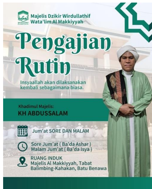
Gambar 4.1 Pamflet Pengajian Rutin Majelis Taklim

Pengajian rutin yang dilaksanakan disetiap minggunya yaitu pada malam Jumat (Kamis malam) setelah salat Isya, yang dimulai sekitar pukul 19.50 WITA. Kegiatan ini diikuti oleh jemaah dari berbagai kalangan dan diisi dengan penyampaian materi keagamaan, pembacaan doa, serta nasihat keislaman yang bertujuan memperkuat pemahaman tauhid, syariat, dan tasawuf. Selain itu, Majelis Taklim Al-Makkiyyah juga mengadakan pengajian rutin pada sore Jumat setelah salat Ashar, yang dimulai sekitar pukul 16.00 WITA. Pengajian sore ini menjadi sarana pembinaan spiritual yang lebih santai namun tetap fokus pada pendalaman ilmu agama dan penguatan nilai-nilai moral dalam kehidupan sehari-hari. Adapun pamflet kegiatan pengajian rutin Majelis Taklim Al-Makkiyyah dapat dilihat sebagai berikut.