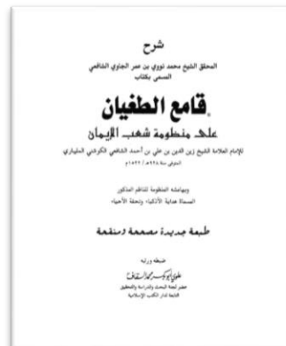
Gambar 4.6 Kitab Qami'ut Tughyan fi Syuabil Iman

Setelah itu, pembahasan dilanjutkan dengan nilai-nilai seperti keikhlasan, kesabaran, tawakal, kejujuran, kepedulian sosial, serta dorongan untuk meningkatkan kualitas iman melalui amal saleh. Dalam sesi ini, KH. Abdussalam menggunakan kitab Qami'ut Tughyan fi Syu'abil Iman sebagai rujukan utama. Berikut ini merupakan gambar kitab Qami'ut Tughyan fi Syu'abil Iman .