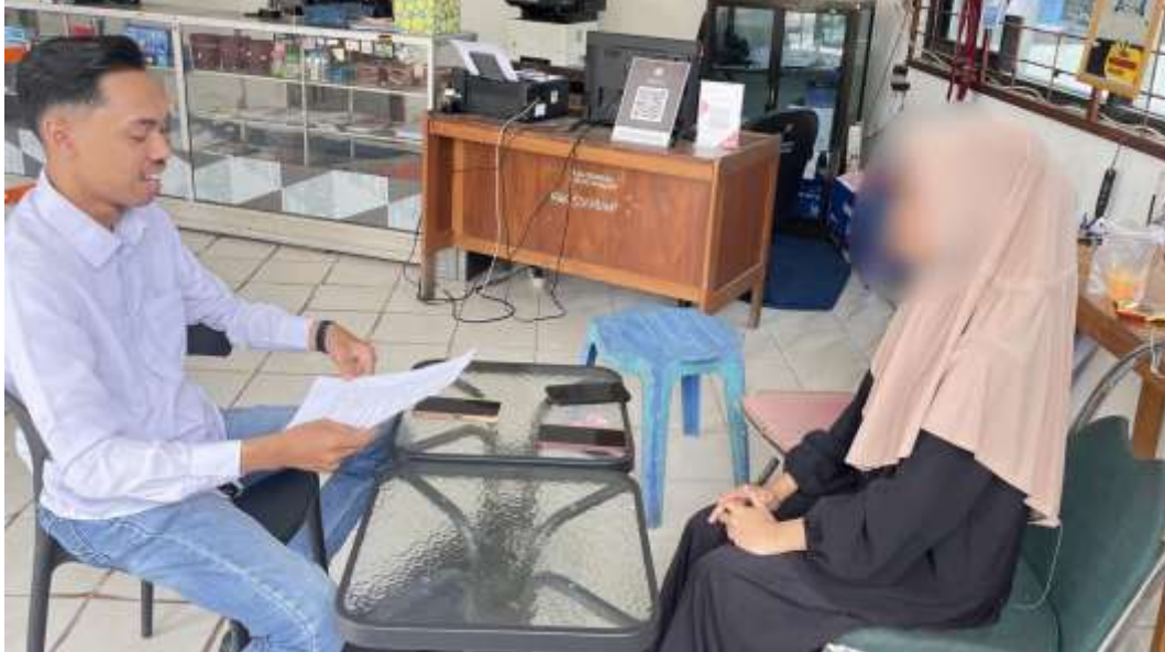
Wawancara bersama informan inisial C