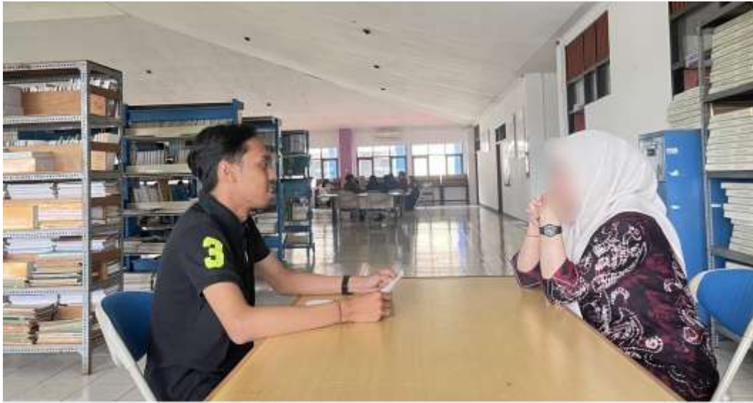
Wawancara bersama informan inisial R