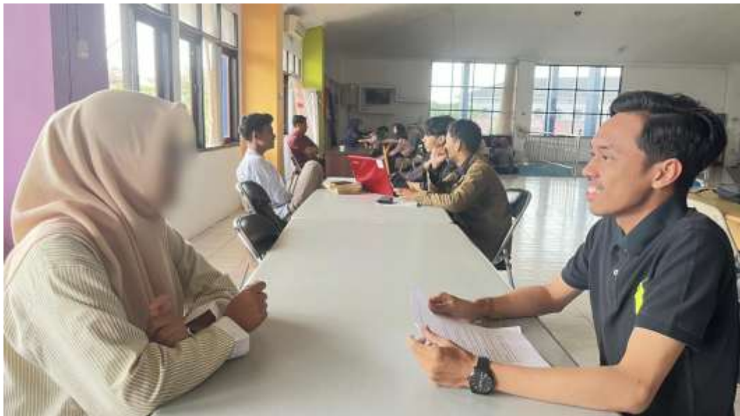
Wawancara bersama informan inisial N