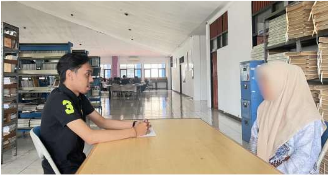
Wawancara bersama informan inisial DHII