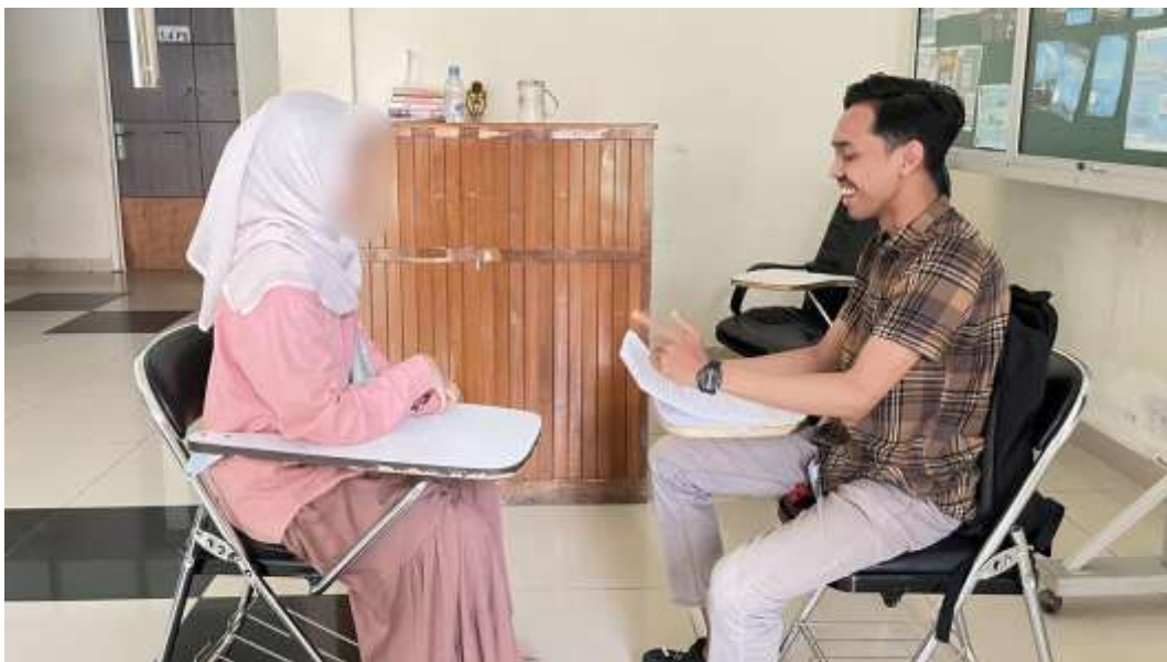
Wawancara bersama informan inisial MH