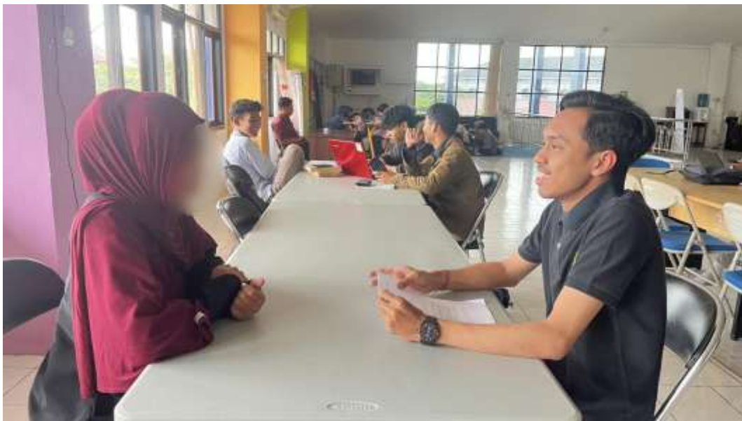
Wawancara bersama informan inisial T