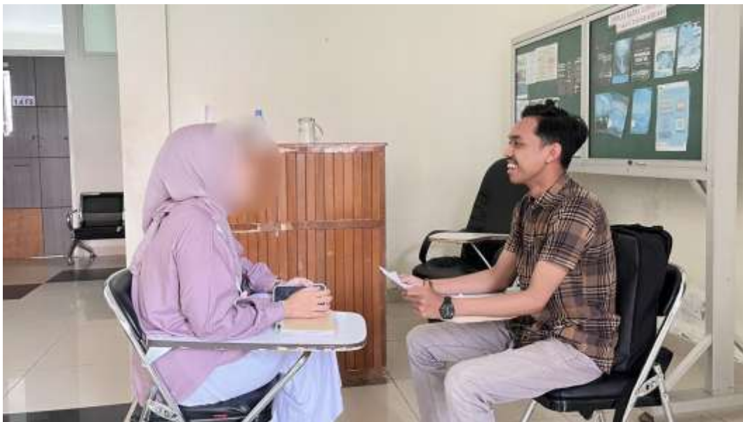
Wawancara bersama informan inisial AJ