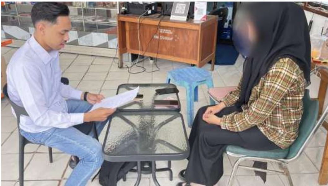
Wawancara bersama informan SWD