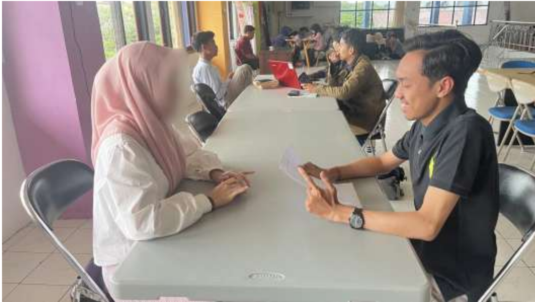
Wawancara bersama informan inisial S