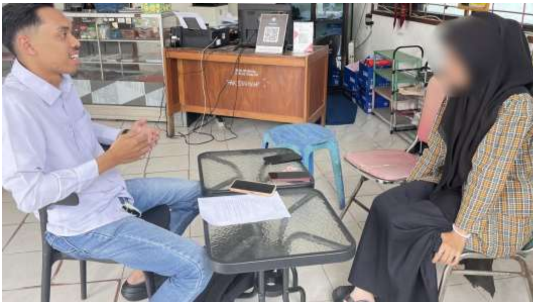
Wawancara bersama informan inisial R