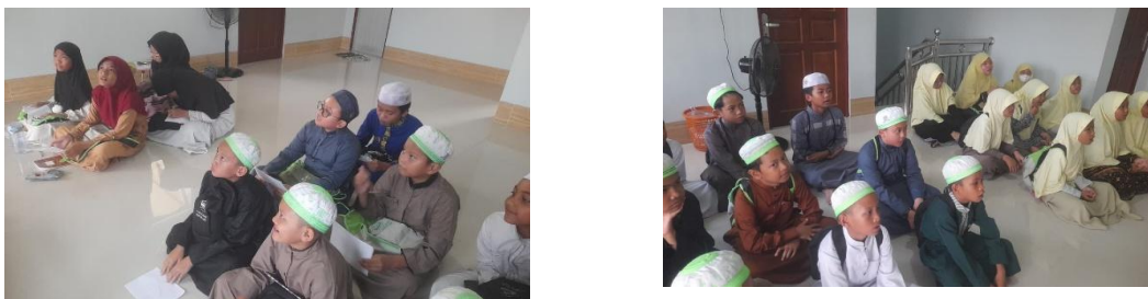
Gambar 4. 11 Kegiatan Pembelajaran di Rumah Qur'an Alwi Al-Bahri

Center & Broom, yang melihat tujuan sebagai hasil yang harus dicapai. 78