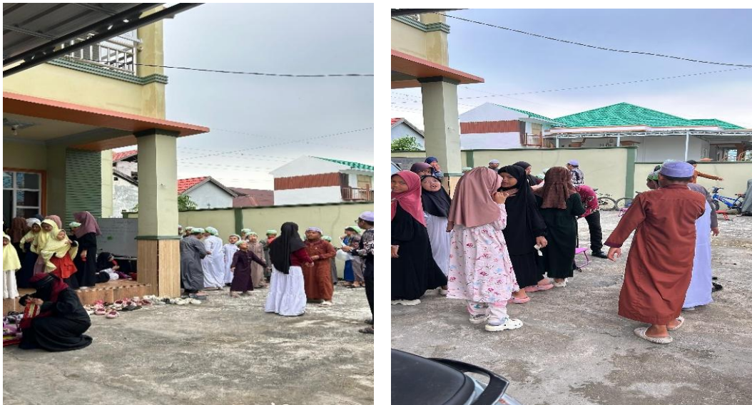
Gambar 4. 6 Pelaksanaan Lomba 17 Agustus

Pengurus dan pengajar juga aktif dalam kegiatan haul Abah Guru Sekumpul, di mana mereka terjun langsung membantu relawan dan membagikan makanan kepada jamaah. Seperti yang disampaikan oleh M. Insan Kamil: