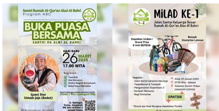
Gambar 4. 4 Acara Buka Bersama dan Jalan Santai