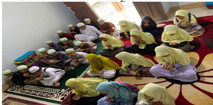
Gambar 4. 3 Santri Rumah Qur'an Alwi Al-Bahri

Yang paling menarik perhatian saya adalah bagaimana lembaga ini mengajarkan Al-Qur'an dengan cara yang menyenangkan dan dan mengajar anak-anak untuk lebih dekat dengan agama. 52