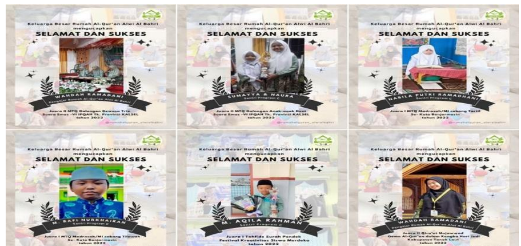
Gambar 4. 10 Prestasi Santri Rumah Qur'an Alwi Al-Bahri