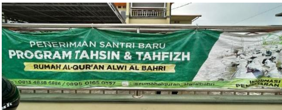
Gambar 4. 2 Rumah Qur'an Alwi Al-Bahri

masyarakat untuk menciptakan generasi yang cinta Al-Qur'an dan berakhlak mulia.