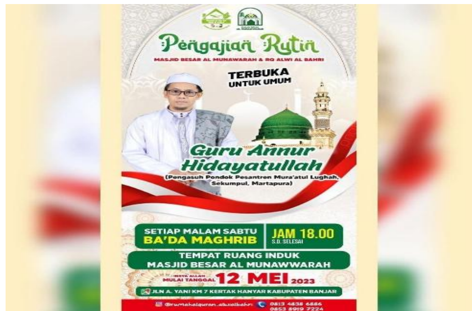
Gambar 4. 9 Majelis Rutinan

rutinan setiap malam Sabtu. Nah itu pang kira-kira kegiatan sosial 70