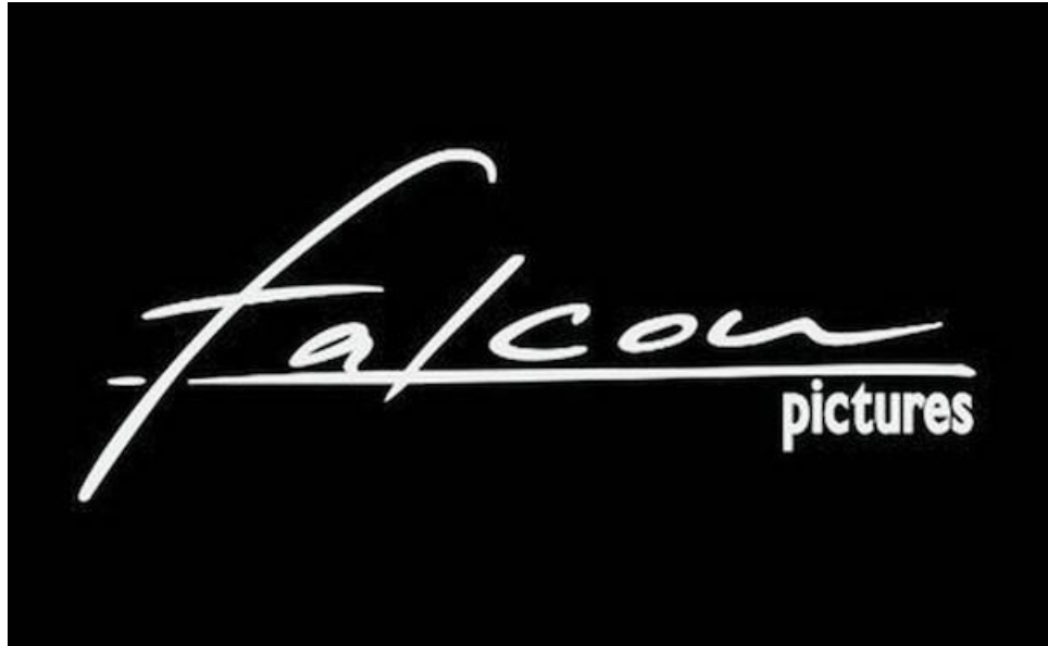
Gambar 3.9 Falcon Pictures

Perusahaan film Indonesia Falcon Pictures didirikan pada 1 Februari 2010 oleh H.B. Neveen, Dallas Sinaga, dan Frederica. Selain itu, Falcon Pictures memiliki anak perusahaan seperti KlikFilm, Kwikku, dan Falcon Publishing, yang merupakan bagian dari Max Pictures. Falcon Pictures berusaha keras untuk menghasilkan produk berkualitas tinggi dalam usahanya untuk menghibur dan memberikan informasi kepada penonton tentang karya mereka.