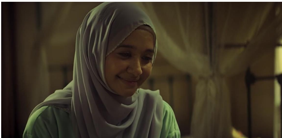
Gambar 3.3 Laudya Cynthia Bella

Laudya Cynthia Bella lahir pada 24 Februari 1988 di Bandung. Dia adalah aktris, penyanyi, dan model berprestasi. Perjalanan kariernya dimulai pada tahun 2002 ketika ia terpilih sebagai Runner-up dalam pemilihan model majalah remaja Kawanku , yang membuatnya berkesempatan muncul dalam berbagai iklan. Bella memulai karir aktingnya pada tahun 2003 dengan membintangi sinetron Senandung Masa Puber di Trans TV. Kariernya semakin cemerlang pada 2004 melalui debut filmnya, Virgin , yang meraih 1,4 juta penonton di Indonesia. Penampilannya dalam film ini membuatnya meraih penghargaan Aktris Utama Terbaik, Aktris Terpuji, serta Most Favorite Rising Star di MTV Indonesia Movie Awards 2005.