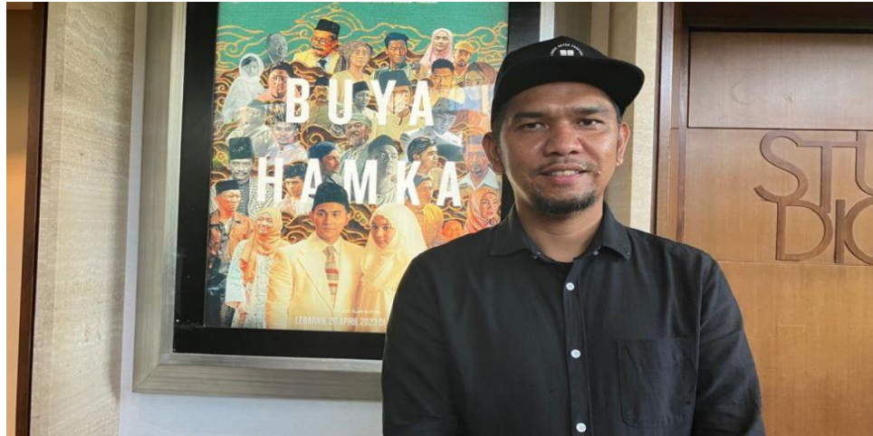
Gambar 3.8 Fajar Bustomi

Fajar Bustomi adalah sutradara terkenal asal Indonesia yang lahir di Jakarta pada 6 Juli 1982. Nama aslinya adalah Fajar, sedangkan "Bustomi" diambil dari nama ayahnya. Ia menempuh pendidikan tinggi di Institut Kesenian Jakarta, dengan jurusan Penyutradaraan Film.