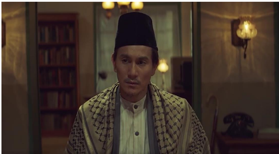
Gambar 3.2 Vino G. Bastian