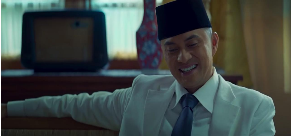
Gambar 3.7 Anjasmara

Anjasmara memulai karier aktingnya pada tahun 1993. Aktor asal Jawa Timur ini merupakan suami dari Dian Nitami. Ia tidak hanya bermain sebagai aktor, tetapi juga menjadi model, penyanyi, dan produser. Sinetron Si Cecep pada tahun 2003 membuat namanya terkenal. Sepanjang kariernya di dunia akting, Anjasmara telah menerima banyak nominasi penghargaan. Selain itu, ia juga aktif sebagai instruktur yoga. 12 Dalam film Buya Hamka , Anjasmara dipercaya memerankan Soekarno, yang ia bawakan dengan baik melalui tata rias dan akting yang meyakinkan.