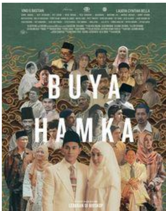
Gambar 3.1 Poster Film Buya Hamka Volume 1

dirilis. 5 Film Buya Hamka volume 1 ini berhasil mendapatkan perhatian publik dengan jumlah penonton mencapai 1.297.791.