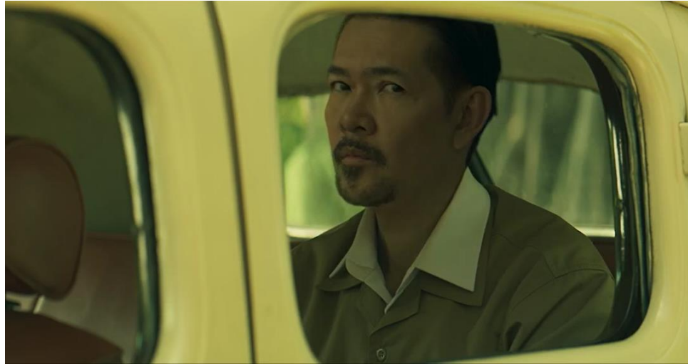
Gambar 3.6 Ferry Salim

Fery Salim adalah seorang aktor keturunan Tionghoa yang lahir pada tahun 1967. Ia adalah ayah dari Brandon Salim. Fery menjadi terkenal setelah berperan sebagai Tan Peng Liang dalam film Ca Bau Kan , yang dirilis pada tahun 2002. Pada tahun 2004, ia ditunjuk oleh UNICEF sebagai duta nasional untuk Indonesia. Dia tidak hanya berkarir sebagai aktor, tetapi juga menjadi presenter dan model. 11 Fery berperan sebagai Gubernur Nakashima, Gubernur Jepang di Sumatera Timur, dalam film Buya Hamka Volume 1 .