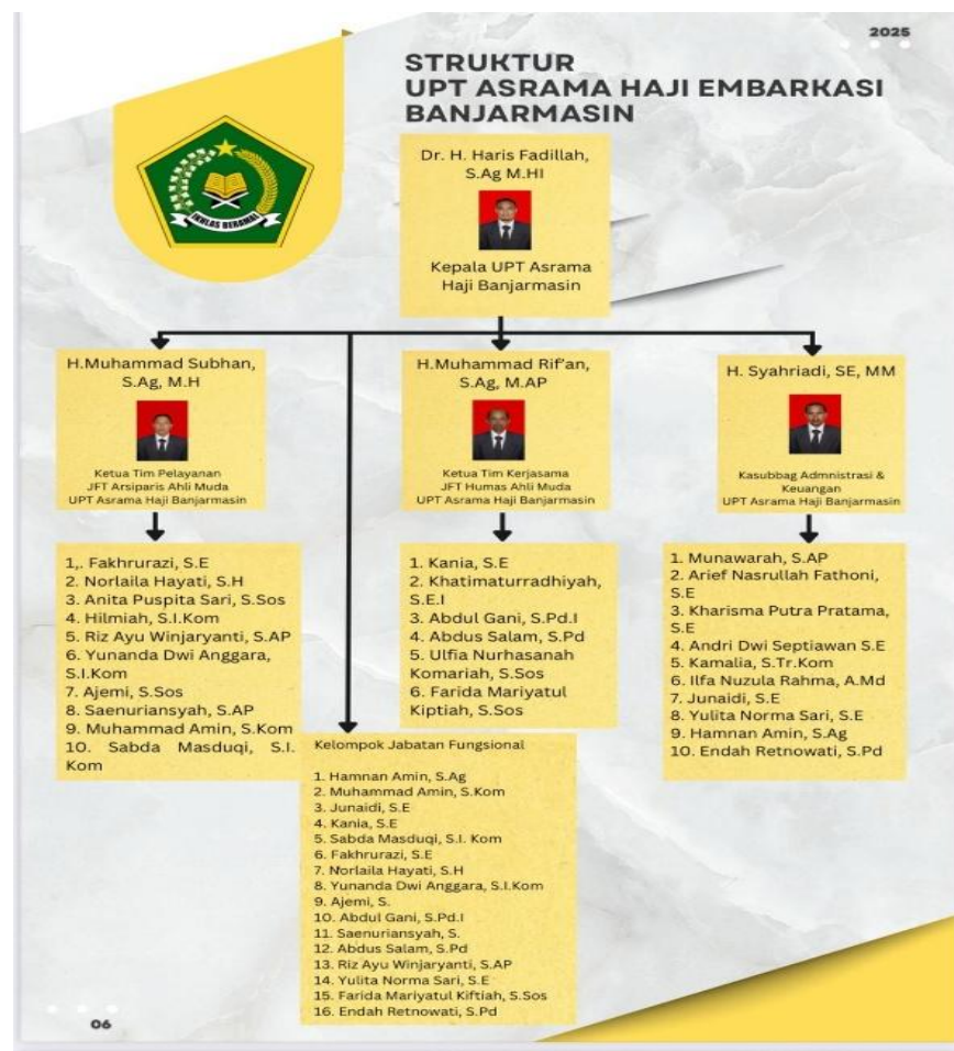
Gambar 4.2 Struktur Jabatan Pegawai