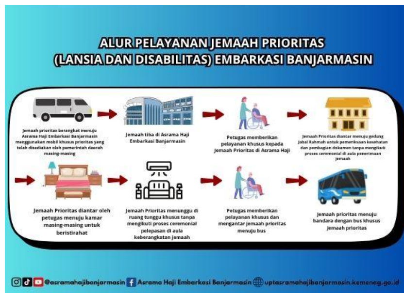
Gambar 4.6 SOP atau Alur Pelayanan

bahwa SOP merupakan acuan petugas untuk melaksanakan pelayanan secara sistematis dan konsisten. Kesesuaian pada prosedur yang dijalankan oleh petugas, serta sesuai dengan alur pelayanan menggambarkan bahwa petugas memahami dengan baik tugas dan tanggung jawab masing-masing. Dengan demikian, dapat dikatakan bahwa petugas haji (PPIH) Embarkasi Banjarmasin memiliki skill yang sesuai dengan kebutuhan untuk pelaksanaan pelayanan ibadah haji. Adapun SOP atau alur pelayanan yang dijalankan oleh petugas haji adalah sebagai berikut: