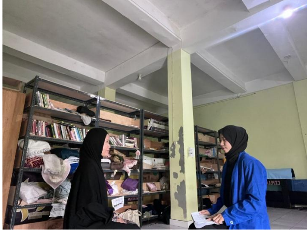
مقابلة مع المعلمة حلياة الأولياء