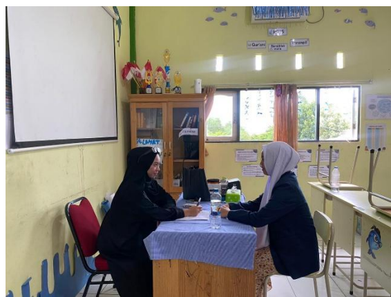
المقابلات مع بعض الطالبات