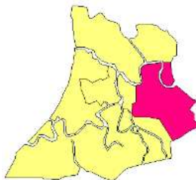
Gambar 1. Peta Kecamatan Banjarmasin Timur

Salah satu dari lima kecamatan di wilayah administratif Kota Banjarmasin, Provinsi Kalimantan Selatan, adalah Kecamatan Banjarmasin Timur. Kecamatan ini dihuni oleh 125.130 orang dan memiliki luas sekitar 23,86 km 2 , sehingga tingkat kepadatan penduduknya berkisar 5.244 jiwa per km 2 (D. K. dan P. S. K. Banjarmasin, 2023). Tingginya kepadatan penduduk tersebut menunjukkan bahwa Kecamatan Banjarmasin Timur memiliki potensi pasar yang cukup besar, terkhusus untuk perkembangan (UMKM) yang sangat bergantung pada intensitas aktivitas masyarakat dan jumlah konsumen.