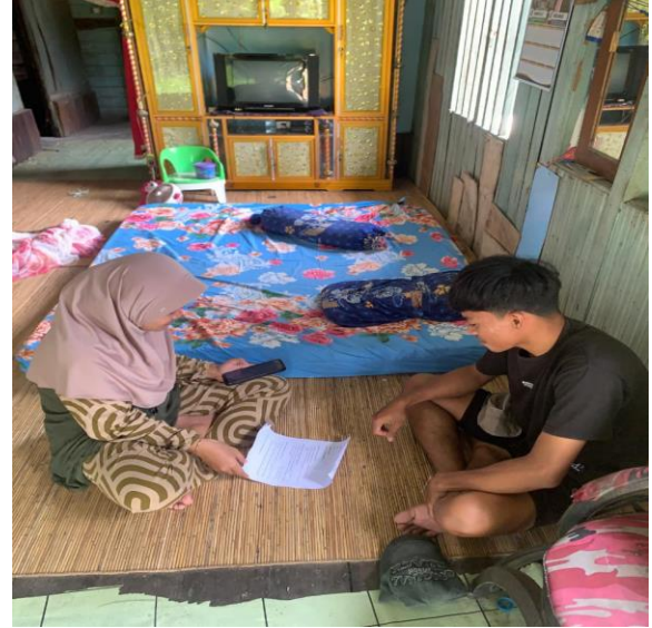
Wawancara bersama bapa riki