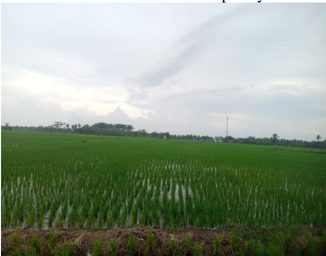
Foto lahan sawah