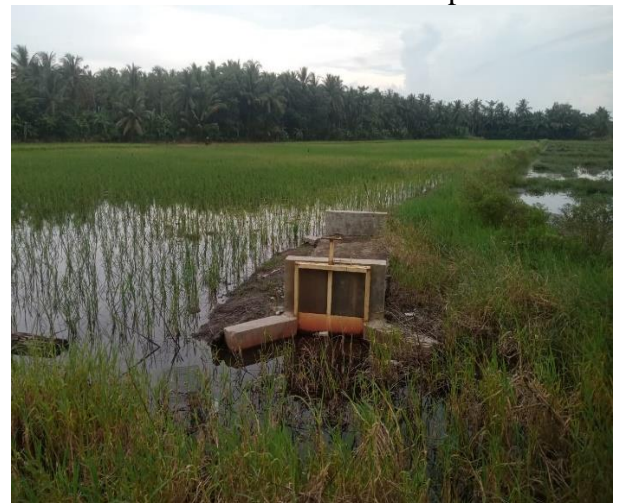
Foto gorong-gorong/saluran air