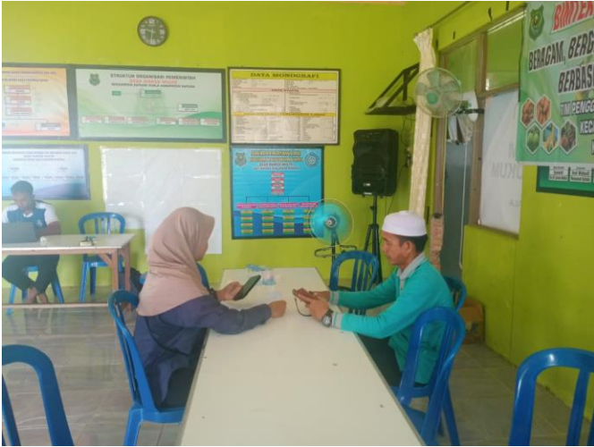
Wawancara bersama bapa murhan