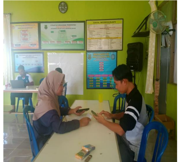
Wawancara bersama bapa hairi