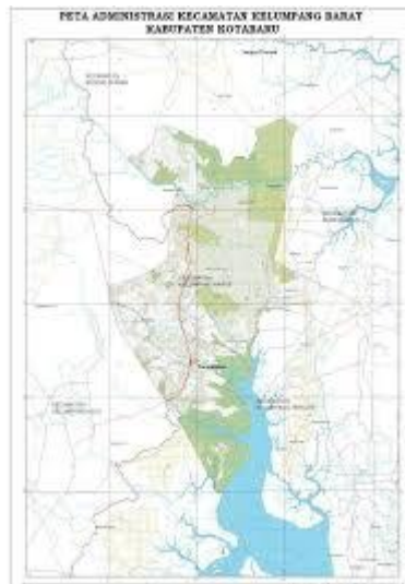
Gambar 4 1: Peta Kec. Kelumpang Barat

Kecamatan Kelumpang Barat adalah salah satu wilayah dari Kabupaten Kotabaru, Provinsi Kalimantan Selatan. Secara geografis kecamatan kelumpang barat berbatasan langsung dengan Kecamatan Sampanahan pada bagian utara, Kecamatan Kelumpang Selatan pada bagian Selatan, Kecamatan Kelumpang Hulu pada bagian Timur, dan pada bagian barat berbatasan dengan Kabupaten Tanah Bumbu.