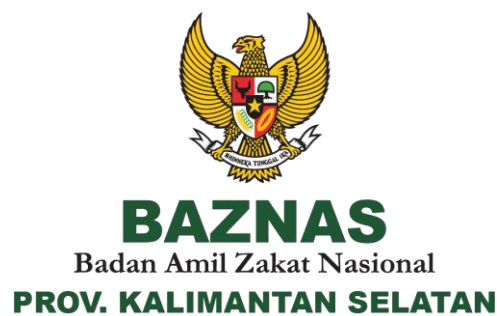
Gambar 4.1 Logo BAZNAS Provinsi Kalimantan Selatan