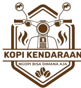
Gambar 4.1 Logo Usaha Kopi Kendaraan