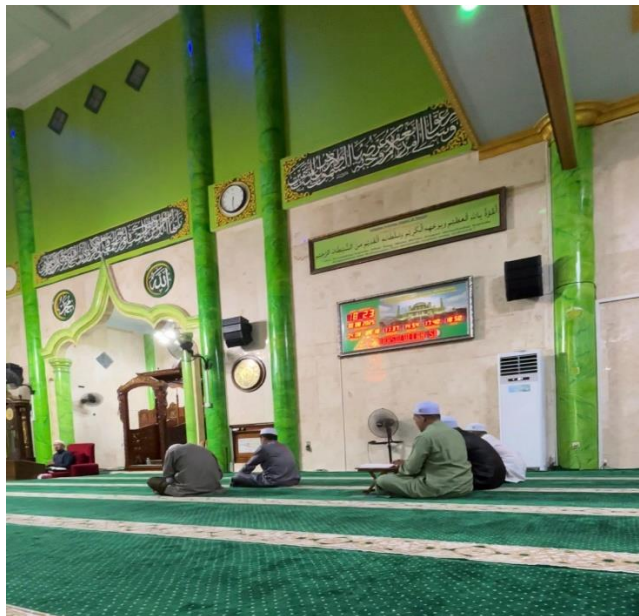
Kegiatan rutin setiap malam minggu