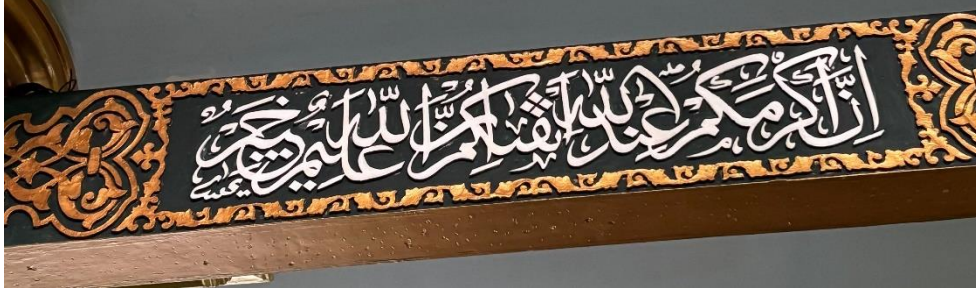
Gambar 4.9 Di bawah plafon samping kanan khat Tsuluts QS. Al-Hujurat diakhir ayat 13.

“Bersegeralah menuju ampunan dari Tuhanmu dan surga (yang) luasnya (seperti) langit dan bumi yang disediakan bagi orang-orang yang bertakwa.”