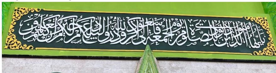
Gambar 4.16 Di bagian depan mihrab, khat Tsuluts QS. Al-Jumu'ah ayat 9.

“Perumpamaan orang-orang yang menginfakkan hartanya di jalan Allah adalah seperti (orang-orang yang menabur) sebutir biji (benih) yang menumbuhkan tujuh tangkai, pada setiap tangkai ada seratus biji. Allah melipatgandakan (pahala) bagi setiap yang Dia kehendki. Allah Maha Luas lagi Maha mengetahui.”