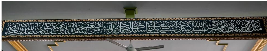
Gambar 4.15 Di bawah plafon bagian tengah, khat Tsuluts QS. Al-Baqarah ayat 161.

“Katakanlah (Nabi Muhammad), Aku berlindung kepada Tuhan manusia, raja manusia, sembah manusia, dari kejahatan (setan) pembisik yang bersembunyi, yang membisikan (kejahatan) ke dalam dada manusia, dari (golongan) jin dan manusia.”