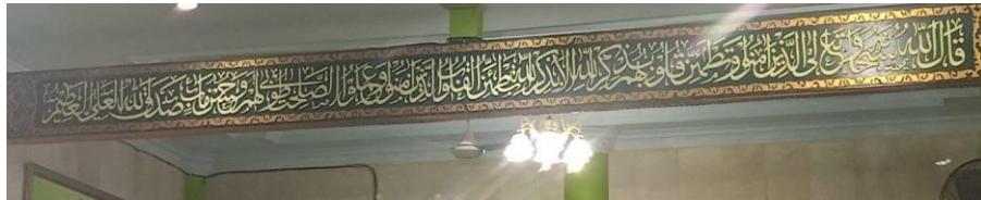
Gambar 4.11 Di bawah plafon sebelah kanan, khat Tsuluts QS. Ar-Ra'd ayat 28.

الَّذِينَ آمَنُوا وَتَطْمَئِنُّ قُلُوبُهُمْ بِذِكْرِ اللَّهِ أَلَا بِذِكْرِ اللَّهِ تَطْمَئِنُّ الْقُلُوبُ ﴿٢٨﴾