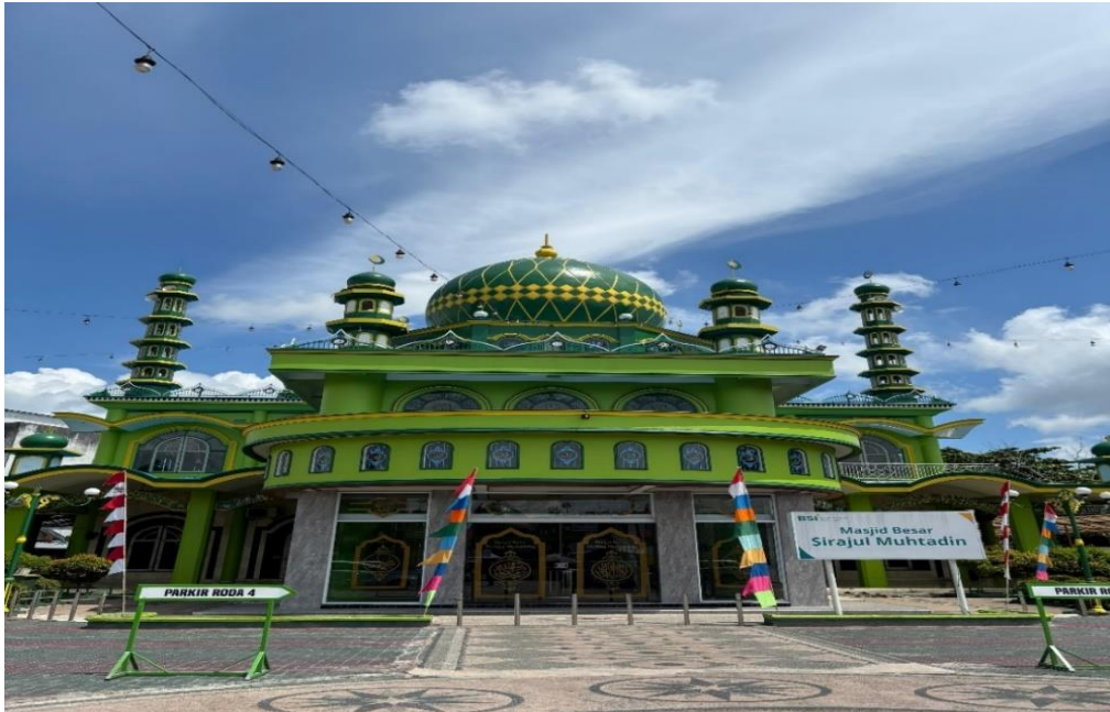
Gambar 4.1: Masjid Besar Sirajul Muhtadin, dibangun pada tahun 1972

Dengan tujuan untuk menyediakan fasilitas ibadah yang r umat Islam di wilayah tersebut. Sejak awal berdirinya, masjid ini sudah mengusung konsep arsetektur Islami yang dipadukan dengan nilai-nilai budaya lokal.