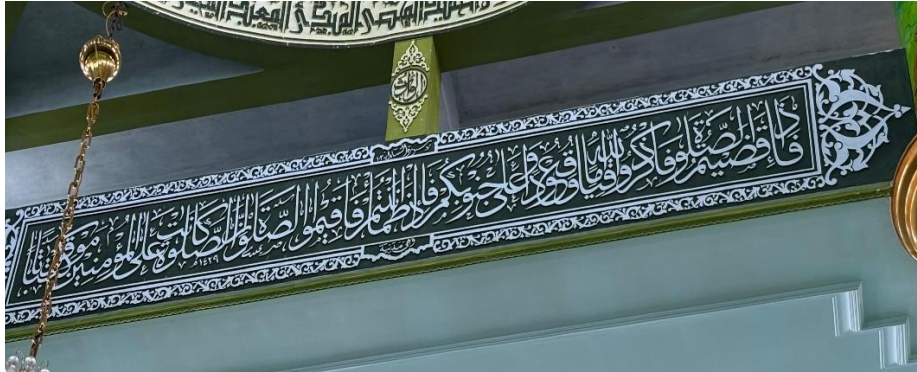
Gambar 4.7 Sebelah kiri di bawah kubah khat Tsuluts QS. Al-Jumu'ah ayat 10.

فَإِذَا قُضِيَتِ الصَّلَاةُ فَانْتَشِرُوا فِي الْأَرْضِ وَابْتَغُوا مِنْ فَضْلِ اللَّهِ وَاذْكُرُوا اللَّهَ كَثِيرًا لَعَلَّكُمْ تُفْلِحُونَ ﴿١٠﴾