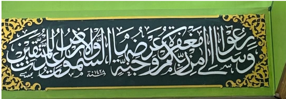
Gambar 4.8 Di depan masjid sebelah kanan khat tsuluts QS. Ali Imran ayat 133.

“Apabila salat jumat telah dilaksanakan, bertebaranlah kamu di bumi, carilah karunia Allah, dan tinggalkan jual beli. Yang demikian itu lebih baik bagimu jika kamu mengetahui.”