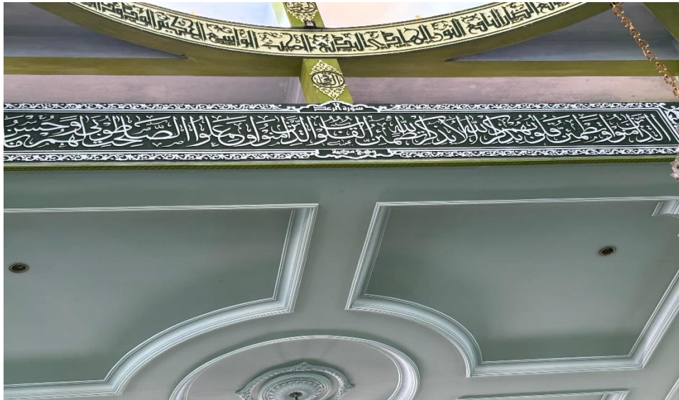
Gambar 4.6 Di depan bagian bawah kubah khat Tsuluts QS. Ar-Ra'ad ayat 28-29.

الَّذِينَ آمَنُوا وَتَطْمَئِنُّ قُلُوبُهُمْ بِذِكْرِ اللَّهِ أَلَا بِذِكْرِ اللَّهِ تَطْمَئِنُّ