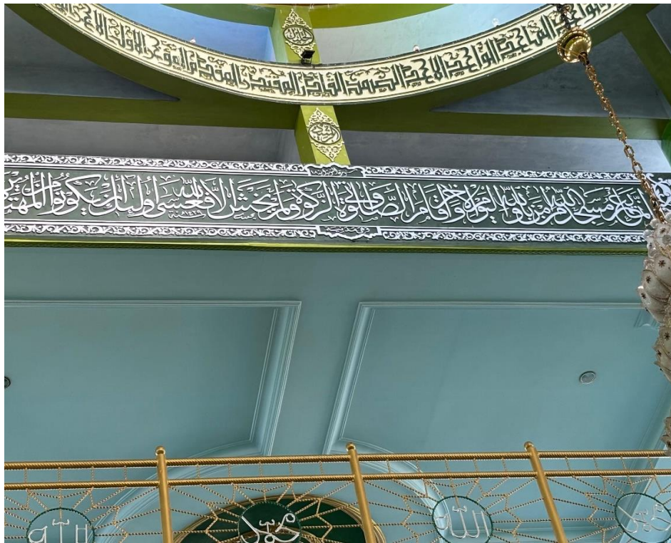
Gambar 4.5 Di belakang bagian bawah kubah khat Tsuluts QS. At-Taubah ayat 18.

إِنَّمَا يَعْمُرُ مَسْجِدَ اللَّهِ مَنْ آمَنَ بِاللَّهِ وَالْيَوْمِ الْآخِرِ وَأَقَامَ الصَّلَاةَ وَآتَى