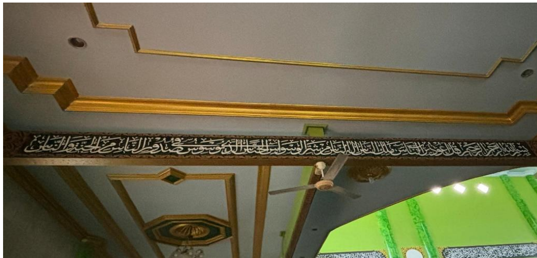
Gambar 4.14 Di bawah plafon, khat Tsuluts QS. An-Nas

“Katakanlah (Nabi Muhammad), Dialah Allah Yang Maha Esa. Allah tempat meminta segala sesuatu. Dan tidak beranak dan tidak pula diperanakkan. Serta tidak ada sesuatu pun yang setara dengan-Nya.”