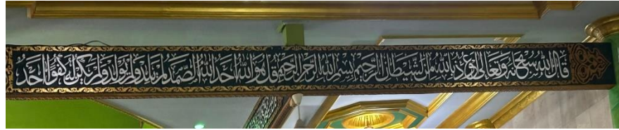
Gambar 4.13 Di bawah plafon, khat Tsuluts QS. Al-Ikhlâs

قُلْ هُوَ اللَّهُ أَحَدٌ ۝١ اللَّهُ الصَّمَدُ ۝٢ لَمْ يَلِدْ وَلَمْ يُولَدْ ۝٣ وَلَمْ يَكُنْ لَهُ كُفُوًا أَحَدٌ ۝٤