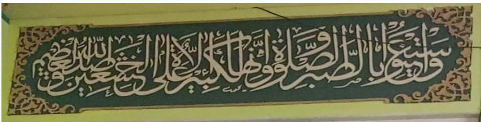
Gambar 4.3 Di dinding depan masjid, khat Tsuluts , QS. Al-Baqarah ayat 45.

وَاسْتَعِينُوا بِالصَّبْرِ وَالصَّلَاةِ وَإِنَّهَا لَكَبِيرَةٌ إِلَّا عَلَى الْخَاشِعِينَ ۝٤٥