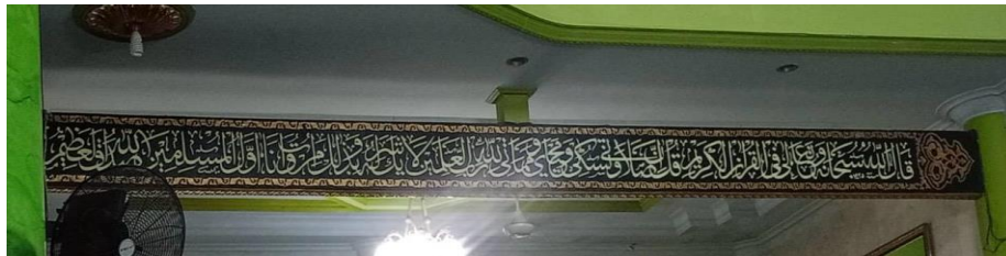
Gambar 4.12 Di bawah plafon sebelah kiri, khat Tsuluts QS. Al-An'am ayat 162-163.

“Yaitu orang-orang beriman dan hati mereka menjadi tenteram dengan mengingat Allah. Ingatlah, bahwa hanya dengan mengingat Allah hati akan selalu tenteram.”