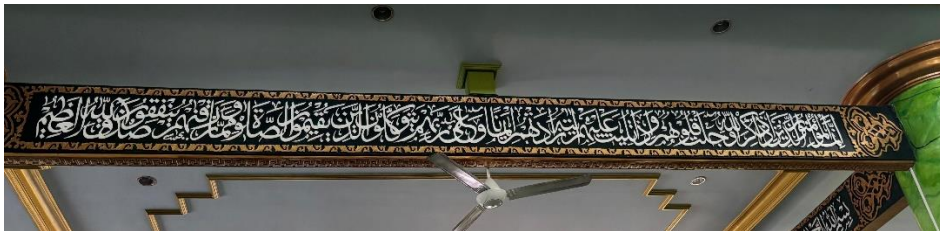
Gambar 4.10 Di bawah plafon khat Tsuluts QS. Al-Anfal ayat 2-3.

“Sesungguhnya orang paling mulia di antara kamu di sisi Allah adalah orang yang paling bertakwa. Sesungguhnya Allah Maha mengetahui lagi Maha Teliti.”