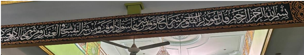
Gambar 4.4 Di bawah plafon masjid, khat Tsuluts, QS. Al-Falaq ayat 1-5

“Dan Mohonlah pertolongan (kepada Allah) dengan sabar dan salat. Sesungguhnya (salat) itu benar-benar berat, kecuali bagi orang-orang yang khusyuk.”