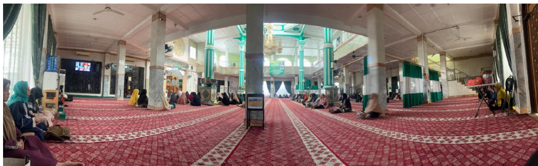
Gambar 4.6 Suasana Kajian Ustadzah Qudsi