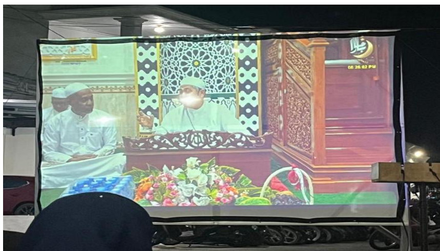
Gambar 4.3 Gerak Tubuh Guru Busu

Tindakan menoleh ini bukan sekadar gerak tubuh biasa, melainkan sebuah bentuk negosiasi status dan validasi informasi dalam sebuah struktur hierarki sosial. Dalam perspektif report talk , tindakan ini menunjukkan bahwa komunikasi beliau berorientasi pada ketepatan informasi dan pengakuan atas keahlian bersama di dalam majelis, sehingga kredibilitas pesan yang disampaikan kepada jamaah tetap terjaga dengan kuat.