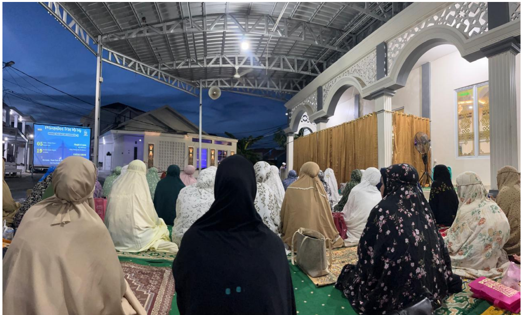
Gambar 4.2 Suasana Kajian Guru Busu

secara simbolis memberikan tanda kepada jemaah bahwa komunikasi sosial biasa telah berakhir dan sesi transfer pengetahuan agama yang formal telah dimulai. Hal ini memperkuat kendali Guru Busu atas perhatian khalayak di ruang publik, yang merupakan salah satu penanda utama gaya komunikasi maskulin.