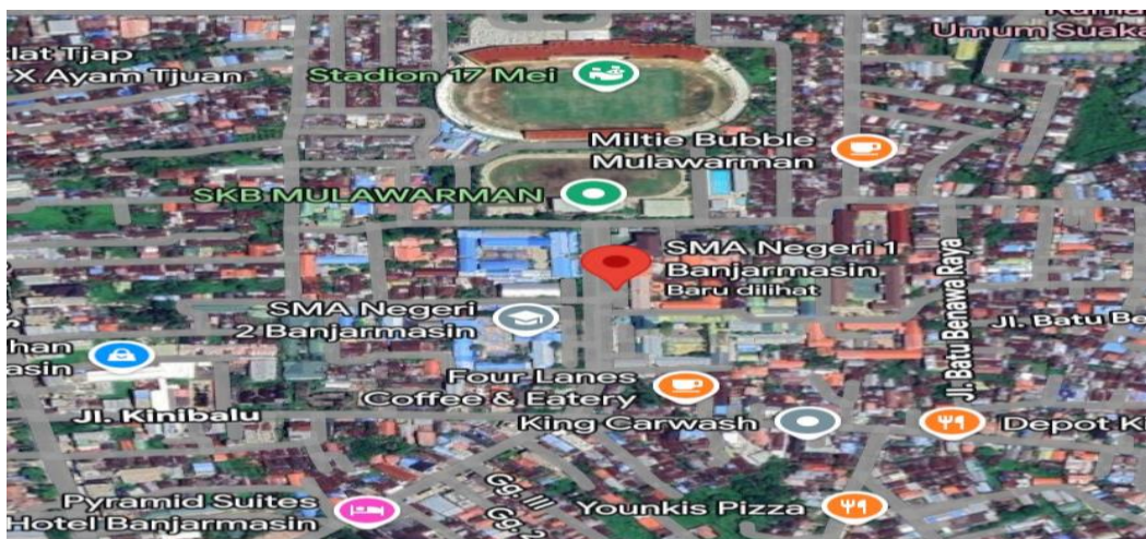
Gambar 3.1 Lokasi SMA Negeri 1 Banjarmasin

https://maps.app.goo.gl/br6Yf3MYp9cMsDi7A?g_st=iw