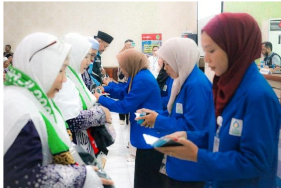
Gambar 4. 4 Proses Pengecekan Dokumen