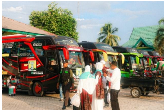
Gambar 4. 14 Kondisi Parkir Bus di Sekitar Aula Mekkah