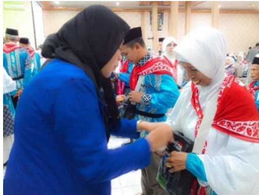
Gambar 4. 5 Proses Penyerahan Dokumen