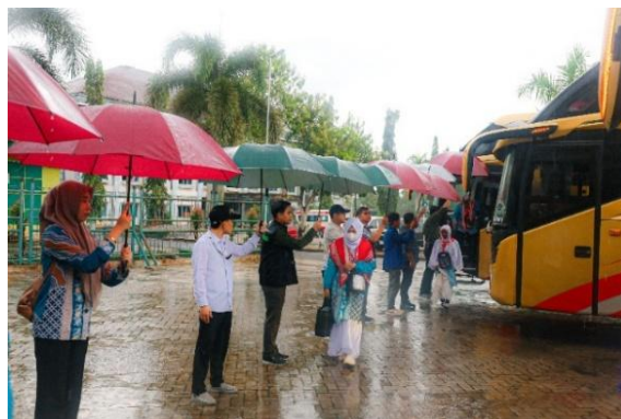
Gambar 4. 13 Petugas Memayungi Jemaah Saat Turun dari Bus di Depan Aula Mekkah