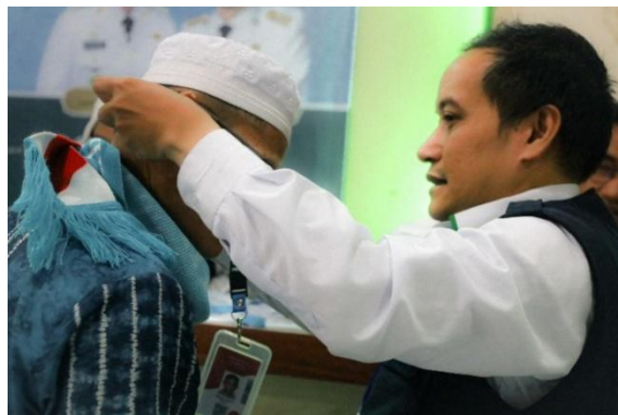
Gambar 4. 8 Pemasangan Kartu Identitas Jemaah Haji