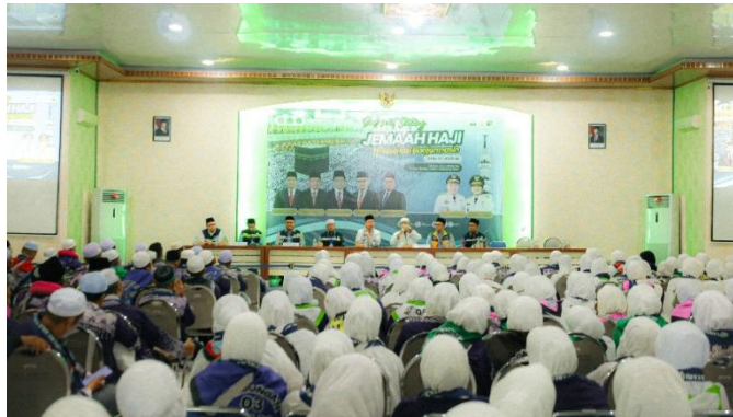
Gambar 4. 3 Proses Implementasi OSS di Aula Mekkah

sehingga jemaah dapat memahami proses pelayanan secara lebih jelas dan mudah.