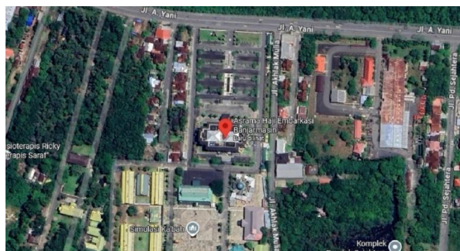
Gambar 4. 2 Lokasi Asrama Haji Embarkasi Banjarmasin