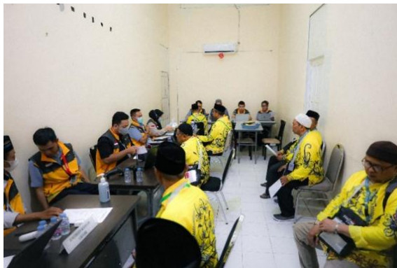
Gambar 4. 10 Pemeriksaan Kesehatan Laki-Laki