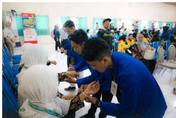
Gambar 4. 9 Pemasangan Gelang Identitas Jemaah Haji