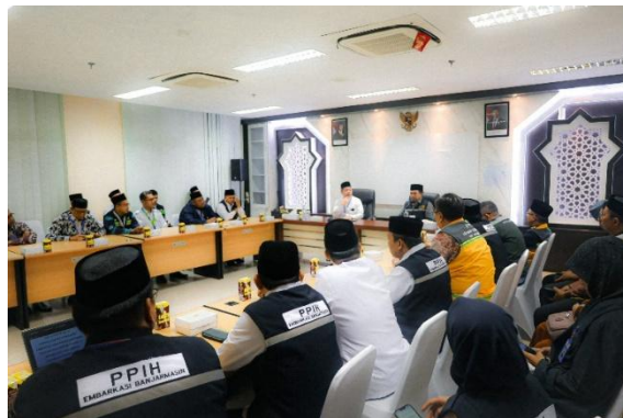
Gambar 4. 12 Rapat Terintegrasi PPIH Embarkasi Banjarmasin