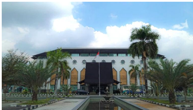
Gambar 4. 1 Asrama Haji Embarkasi Banjarmasin

satu buah aula bernama Mekkah, satu buah musala, dua buah loket bank untuk penukaran mata uang, serta miniatur tempat ibadah haji seperti Ka'bah, Bukit Shafa, Bukit Marwah, dan Jamarat. Pada tahun 2004, asrama haji ini resmi diresmikan sebagai Asrama Haji Embarkasi Banjarmasin, yang bertanggung jawab melayani jemaah haji dari Provinsi Kalimantan Selatan dan Provinsi Kalimantan Tengah.