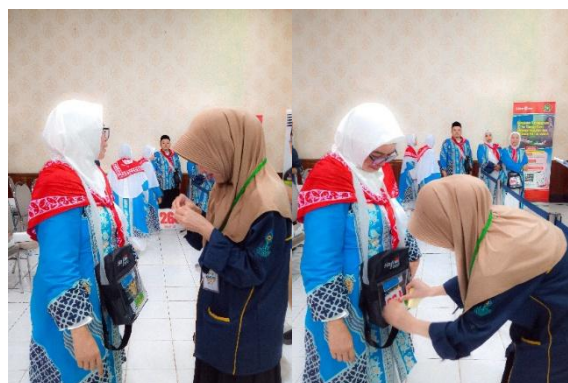
Gambar 4. 6 Proses Pemasangan Stiker Nomor Bus dan Nomor Kursi Pesawat

Berdasarkan temuan penelitian di lapangan, stiker tersebut ditempelkan pada bagian luar tas paspor jemaah, tepatnya pada bagian depan tas sehingga mudah terlihat oleh petugas maupun jemaah itu sendiri. Penempelan stiker pada posisi tersebut dilakukan guna mempermudah pengidentifikasian informasi mengenai nomor bus dan kursi pesawat ketika jemaah diarahkan petugas menuju bus ke bandara maupun pada saat proses keberangkatan.