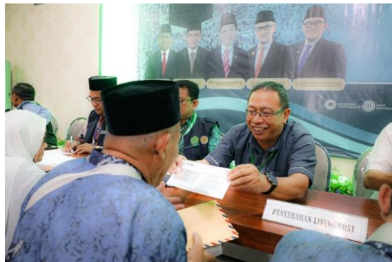
Gambar 4. 7 Penyerahan Uang Living Cost