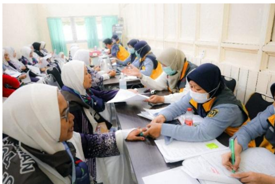
Gambar 4. 11 Pemeriksaan Kesehatan Perempuan