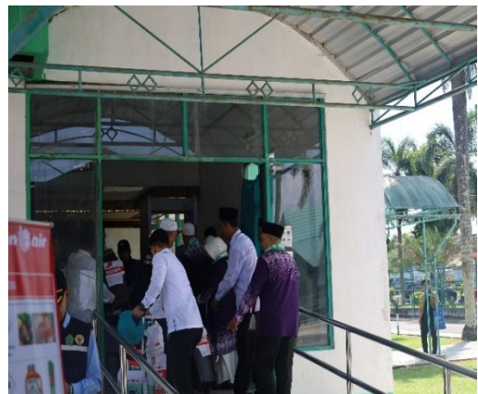
Pemeriksaan barang melalui X-Ray sebelum keberangkatan