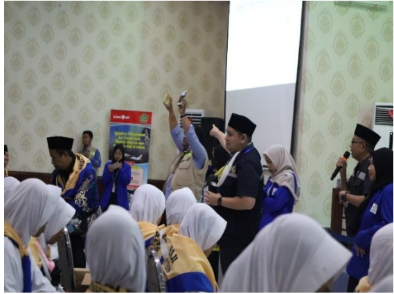
Acara penerimaan jemaah di Aula Mekkah, sambutan dan proses pelaksanaan One Stop Service