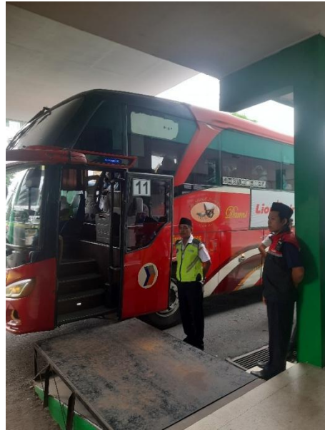
Mengatur jemaah untuk memasuki bus per Rombongan menuju bandara