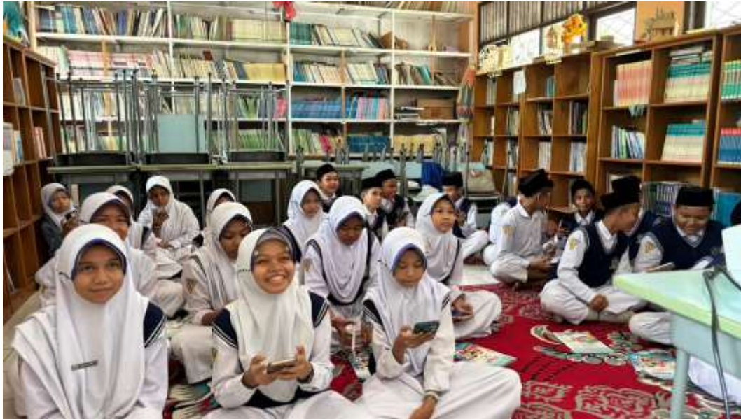
Lampiran 9. Kahoot