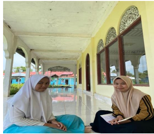
Dokumentasi wawancara dengan Santriwati