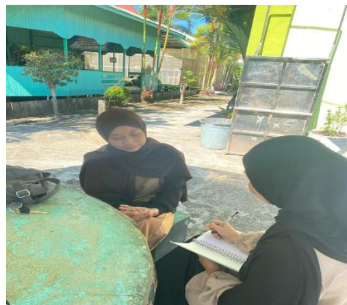
Wawancara Dengan Santriwati