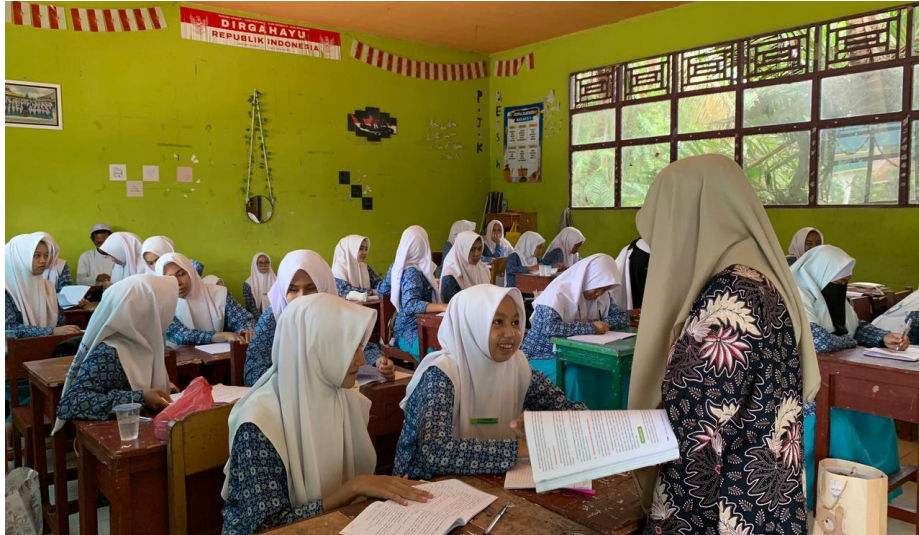
Belajar Kelas Mata Pelajaran Akidah Akhlak