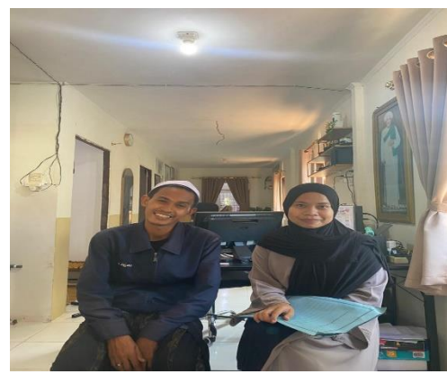
Wawancara Dengan Ustazah/Selaku Pembina Asrama