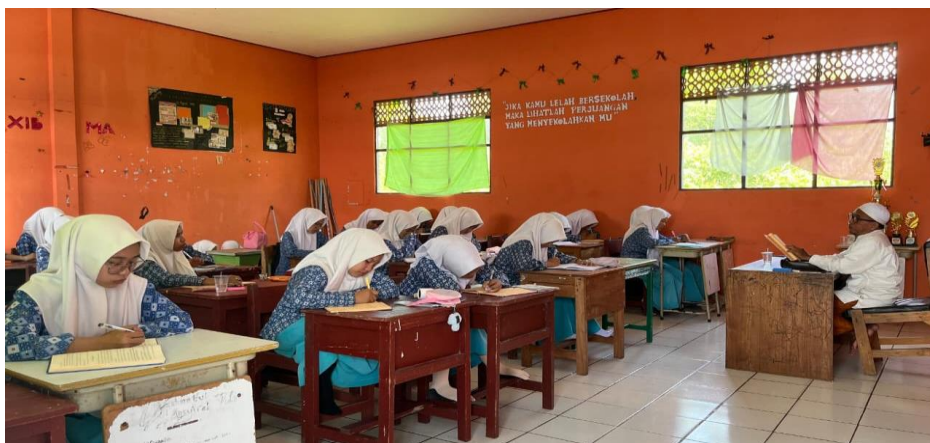
Belajar kitab Ta'lim Mutalim