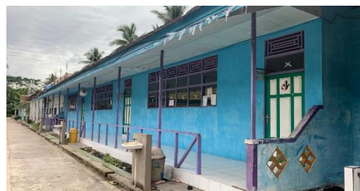
Ruang Kelas belajar Santriwati