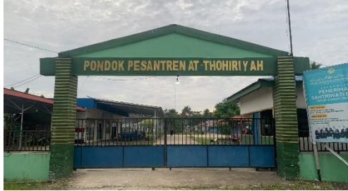
Gerbang Pondok Pesantren