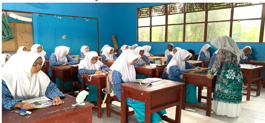
Ulangan Tertulis Mata Pelajaran Akidah Akhlak