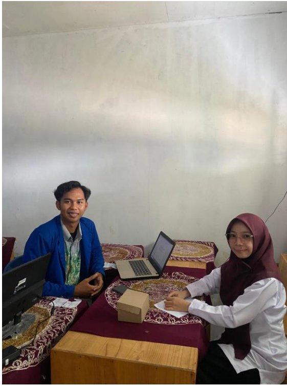
Gambar 5.9 Wawancara dengan ibu R.H.