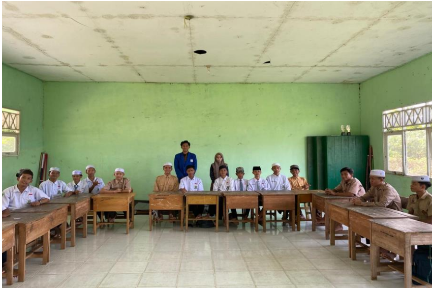
Gambar 5.1 Observasi di kelas XA Putra