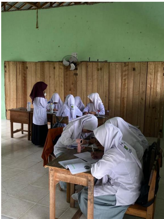
Gambar 5.4 Suasana belajar di kelas XI B putri