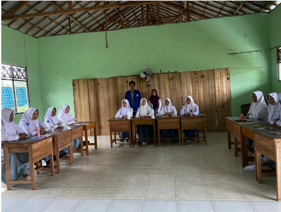
Gambar 5.3 Observasi di Kelas XI B putri