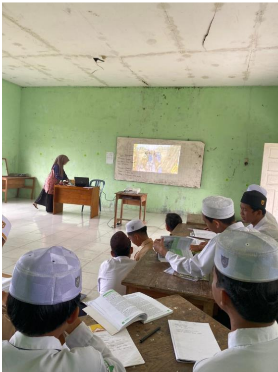
Gambar 5.2 Suasana belajar di kelas XA Putra