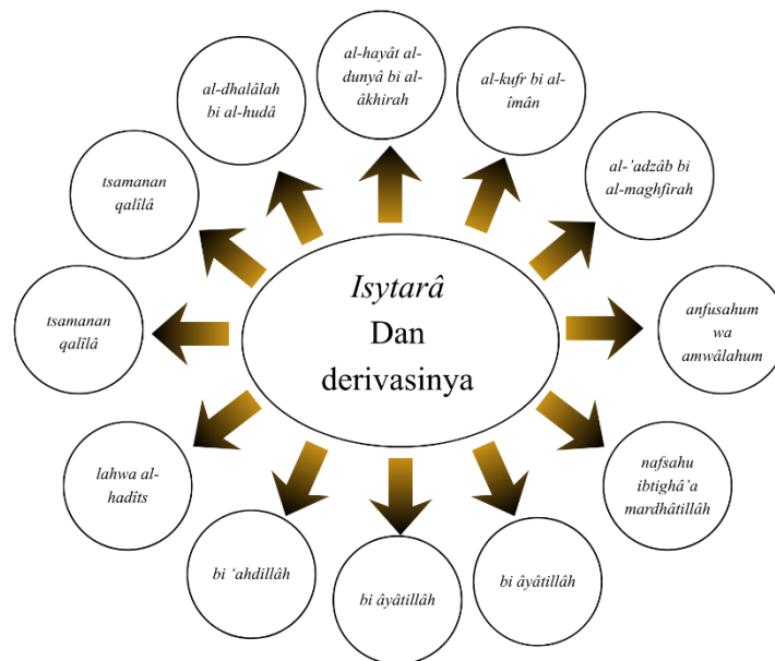
Diagram 4. 1: Medan Semantik Sintagmatik Lafal isytarâ

Berdasarkan diagram tersebut, lafal isytarâ dapat dipetakan ke dalam tiga kerangka konseptual utama sebagai berikut: