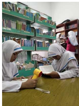
Gambar 4.4 Siswa membaca buku di perpustakaan

Ada siswa yang hanya membaca di dalam tanpa meminjam, itu tetap kami izinkan selama tertib. 52