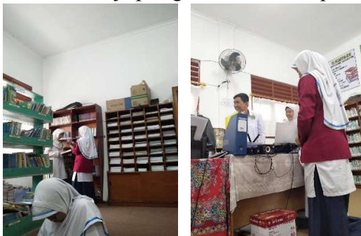
Gambar 4.3 Siswa mencari buku di rak dan mencatat peminjaman buku

Siswa langsung memilih buku di rak sesuai kebutuhan mereka, setelah itu dibawa ke meja petugas untuk dicatat peminjamannya. 49