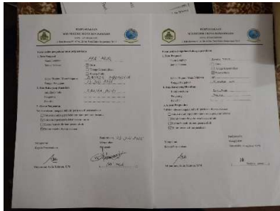
Gambar 4.1 Data kebutuhan buku guru dan siswa

Setiap awal tahun biasanya kami mendata kebutuhan buku yang diperlukan siswa dan guru. Dari situ nanti diajukan penambahan koleksi supaya buku yang ada sesuai dengan kebutuhan pembelajaran. 43