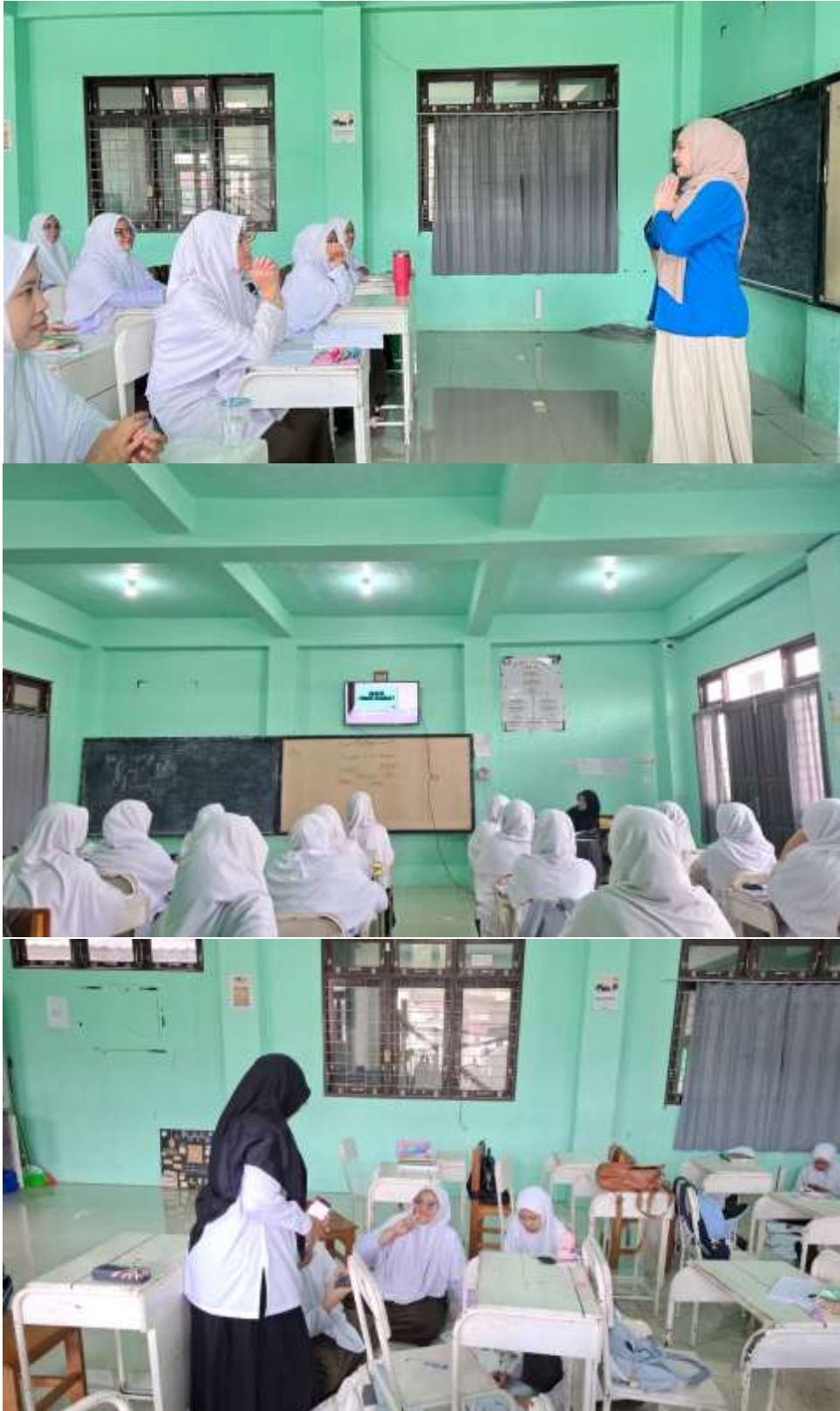
Lampiran 15. Dokumentasi