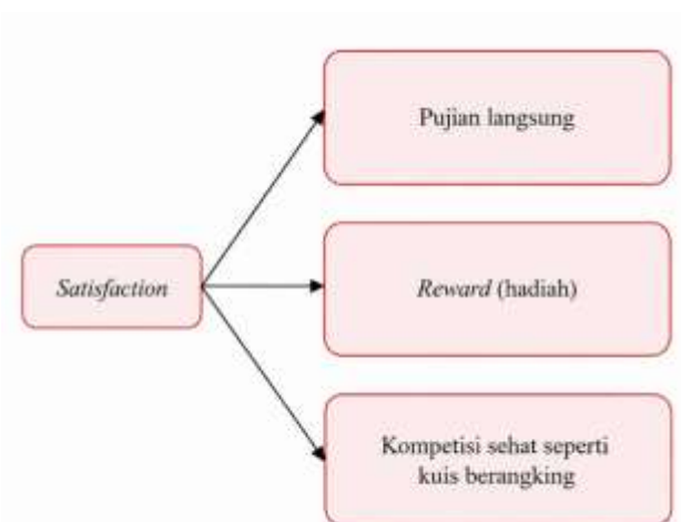
Gambar 4. 4 Aspek Satisfaction

Berdasarkan bagan di atas, dapat dipahami bahwa guru matematika di MAS NIPI RAKHA tidak hanya menggunakan teknik mengajar yang bersifat spontan, melainkan menerapkan sebuah desain strategis yang adaptif. Alasan tindakan guru diklasifikasikan sebagai strategi adalah karena adanya kesinambungan pola antara identifikasi masalah (kesenjangan motivasi) dengan pemilihan tindakan berbasis model ARCS.