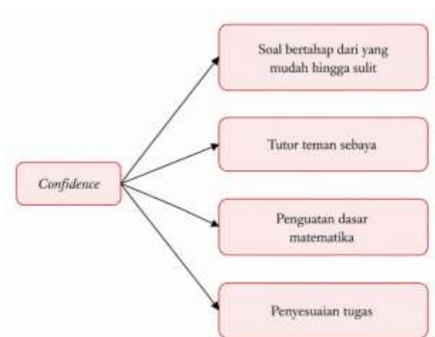
Gambar 4. 3 Aspek Confidence