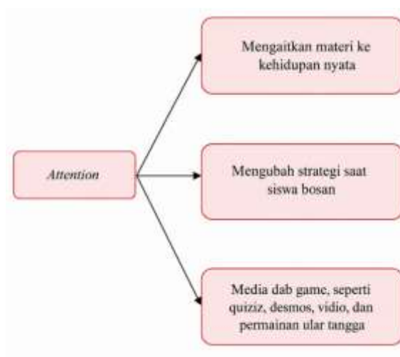
Gambar 4. 1 Aspek Attention

ketika guru mengaitkan materi dengan kehidupan sehari-hari (aspek Attention), tindakan tersebut merupakan pilihan strategis yang dirancang untuk mengatasi rendahnya minat awal siswa, bukan seenggar spontanitas di kelas. Strategi yang telah diterapkan guru didalam kelas telah mencakup keempat indikator pemilihan strategi yang baik yaitu attention , relevance , confidence , dan satisfacation . Hal tersebut dapat kita lihat pada bagan sebagai berikut;