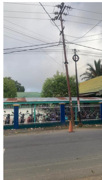
MTsN 4 Hulu Sungai Utara