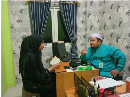
Gambar 4.4 Wawancara dengan Koordinator Tahfizh

Berdasarkan wawancara dengan Koordinator Tahfizh, beliau mengatakan bahwa: