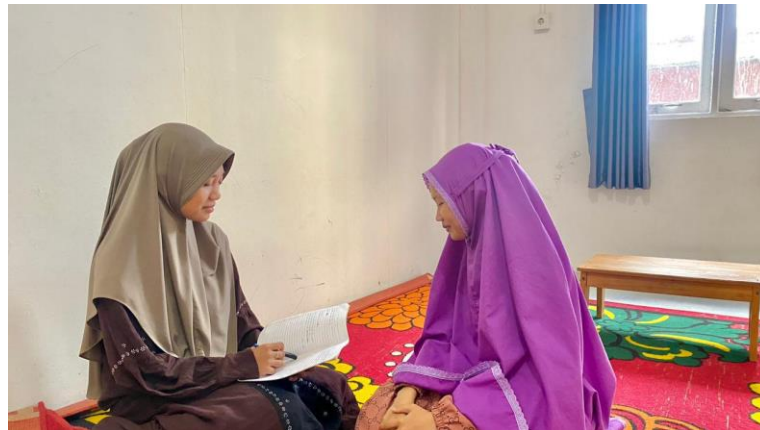
Gambar 4.3 Wawancara dengan Santri, HJ

walaupun menghafal terasa sulit. Jadi walaupun capek atau lagi tidak semangat, tetap diusahakan untuk muraja'ah walaupun sedikit.” 13