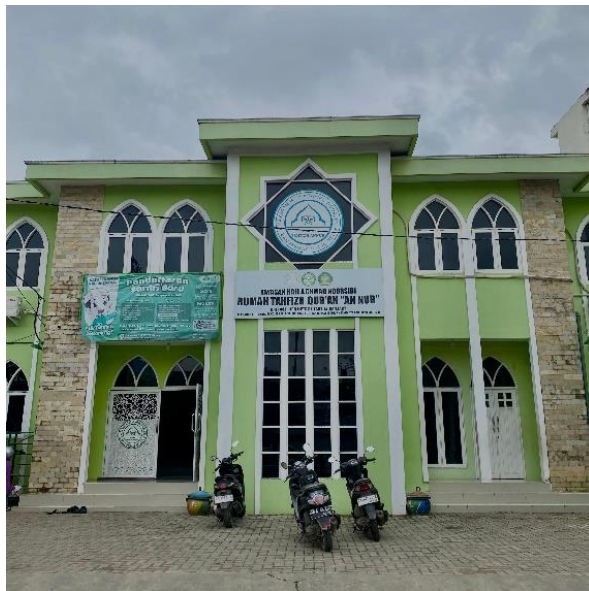
Gambar 4.1 Rumah Tahfizh An Nur Banjarmasin

Nama Lembaga : Rumah Tahfizh An Nur Banjarmasin