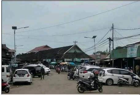
Gambar 4. 2 Pasar Alabio