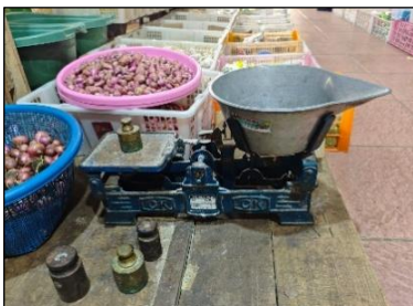
Gambar 4. 5 Timbangan Tradisional (Timbangan kodok)

Pada lapak penjualan bawang merah terlihat penggunaan timbangan meja tradisional (dacing) yang masih difungsikan secara aktif dalam proses transaksi. Barang dagangan diletakkan pada wadah timbangan di satu sisi, sementara anak timbangan ditempatkan di sisi lainnya hingga posisi keduanya seimbang. Aktivitas ini menunjukkan praktik pengukuran massa yang presisi melalui prinsip keseimbangan, perbandingan berat, serta penyesuaian jumlah anak timbangan untuk mencapai kesetaraan. Proses penimbangan ini kemudian diikuti dengan perhitungan harga berdasarkan berat barang (kilogram dikalikan harga satuan), yang merefleksikan penerapan aritmatika sosial secara kontekstual dalam aktivitas jual beli di pasar tradisional.