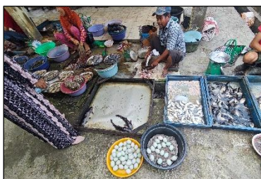
Gambar 4. 6 Lapak Penjual ikan

Pada lapak penjualan ikan dan telur terlihat pengelompokan komoditas berdasarkan jenis dan ukuran dalam wadah berbentuk persegi panjang serta baskom bundar. Ikan dipisahkan menurut ukuran di dalam kotak kayu berisi air, menunjukkan konsep klasifikasi, perbandingan (rasio ukuran), serta pemahaman volume dan kapasitas wadah. Di bagian depan, telur disusun dalam baskom dan dijual per butir atau per jumlah tertentu, mencerminkan penggunaan bilangan cacah dan aritmatika sosial dalam penentuan harga. Aktivitas pedagang yang menimbang, memotong, dan menata hasil dagangan sekaligus memperlihatkan praktik pengukuran, estimasi, serta pengelompokan yang terintegrasi secara alami dalam aktivitas jual beli di pasar tradisional.