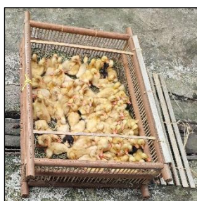
Gambar 4. 9 Wadah anak bebek

Kandang bambu berisi anak itik ini menunjukkan bagaimana pedagang mengatur kepadatan, susunan, dan kapasitas ruang secara intuitif. Anak itik ditempatkan dalam ruang berbentuk persegi panjang dengan alas jerami, disusun rapat namun tetap mempertimbangkan ruang gerak dan sirkulasi udara. Praktik ini merepresentasikan pemahaman tentang konsep luas, volume, dan kepadatan dalam ruang terbatas. Penataan tersebut juga mencerminkan penerapan prinsip perbandingan dan estimasi jumlah berdasarkan ukuran kandang, yang secara tidak langsung memperlihatkan bentuk penalaran matematis dalam pengelolaan komoditas sebelum diperjualbelikan.