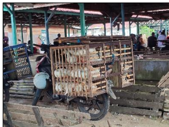
Gambar 4. 8 Motor yang digunakan untuk membawa bebek