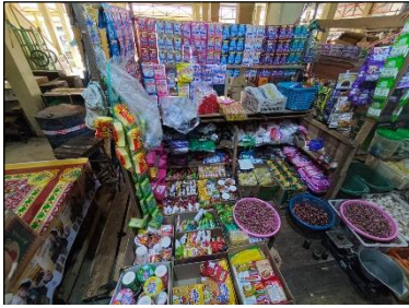
Gambar 4. 4 Lapak jualan kebutuhan sehari-hari