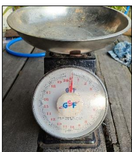
Gambar 4. 7 Timbangan duduk analog

Bentuk skala yang melingkar juga merepresentasikan konsep geometri lingkaran dan pembagian derajat skala secara merata. Dalam praktiknya, pedagang sering melakukan pembulatan hasil pembacaan berat untuk mempermudah perhitungan harga, sehingga aktivitas ini sekaligus memuat konsep pengukuran, bilangan, estimasi, dan aritmatika sosial dalam transaksi jual beli.