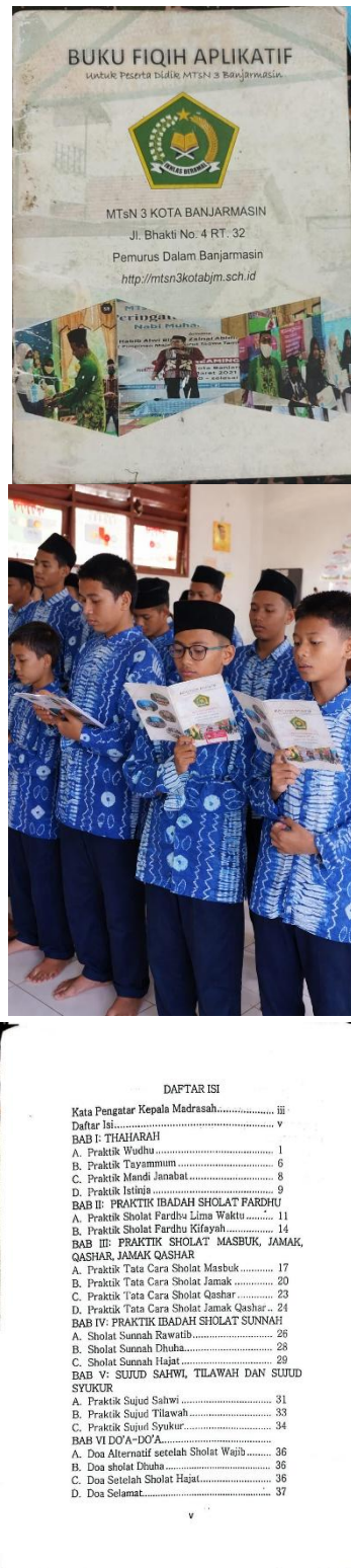
Gambar 6 Program Unggulan Fiqih Aplikatif