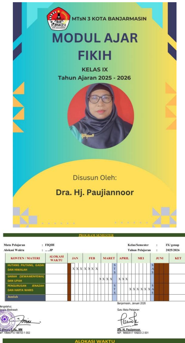
Gambar 10 Modul Ajar Mata Pelajaran Fiqih