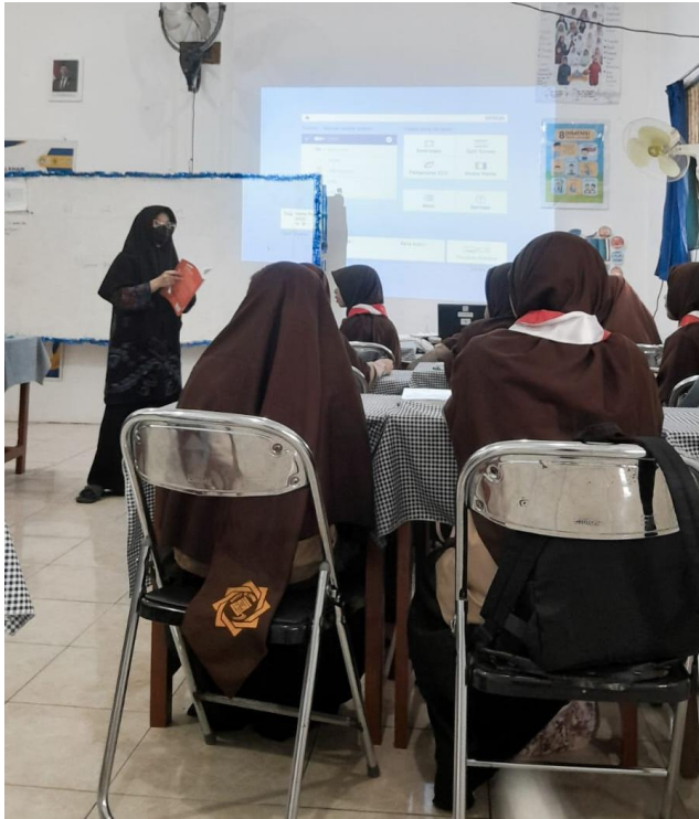
Observasi di Kelas VII B Saat Mata Pelajaran Bahasa Indonesia