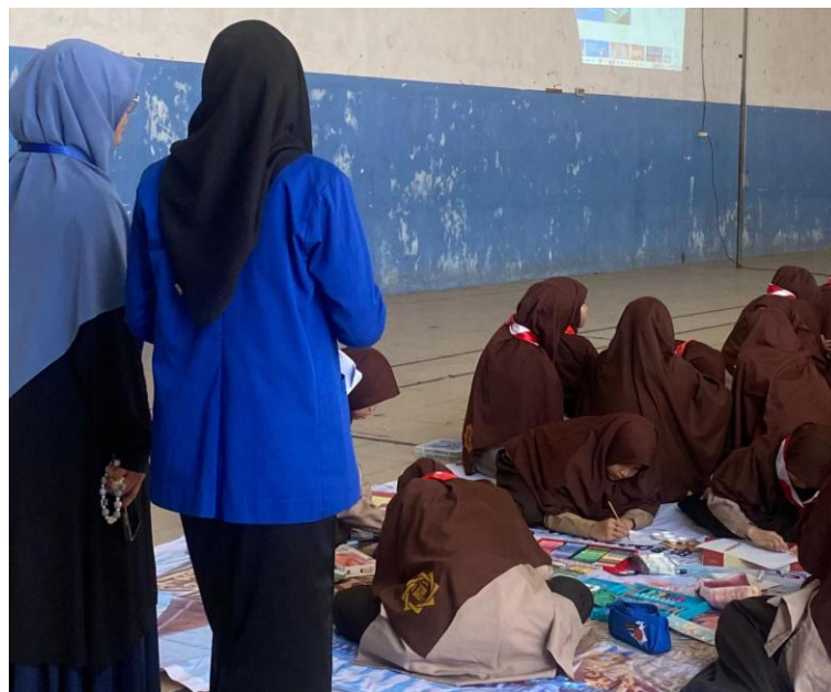
Observasi Program Jumat Literasi