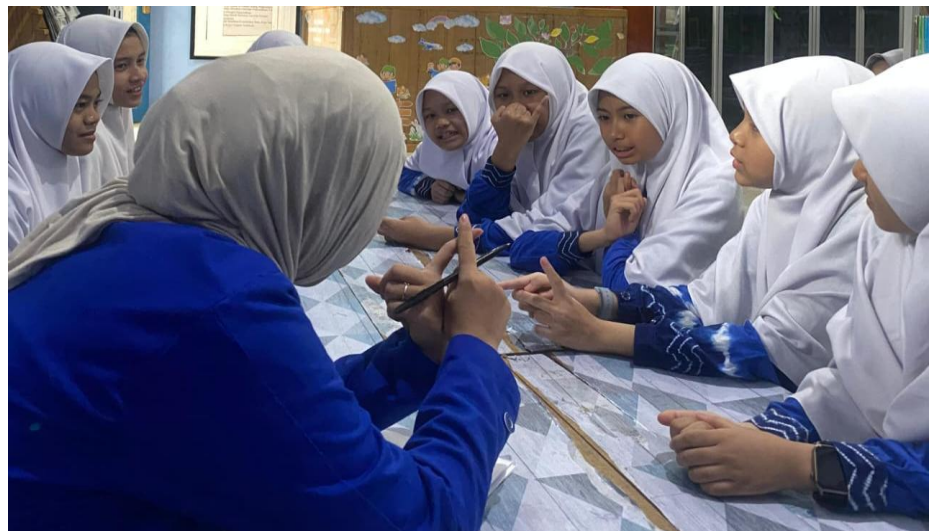
Wawancara Siswa Kelas VII B