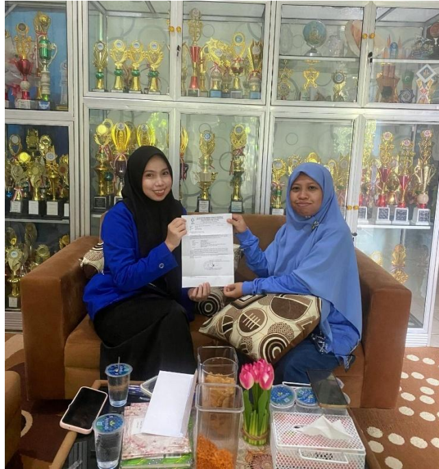
Pengantaran Surat Riset Sekaligus Wawancara Bersama Kepala Sekolah