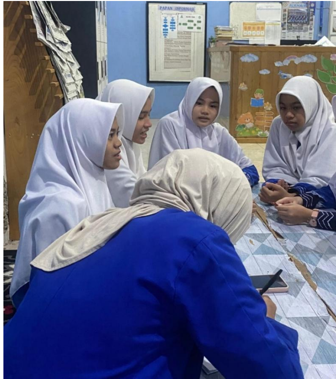
Wawancara Duta Literasi