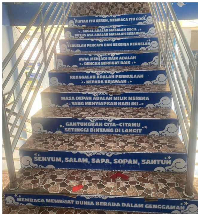
Tangga Penuh Teks