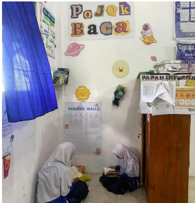
Pojok Baca di Kelas VII B