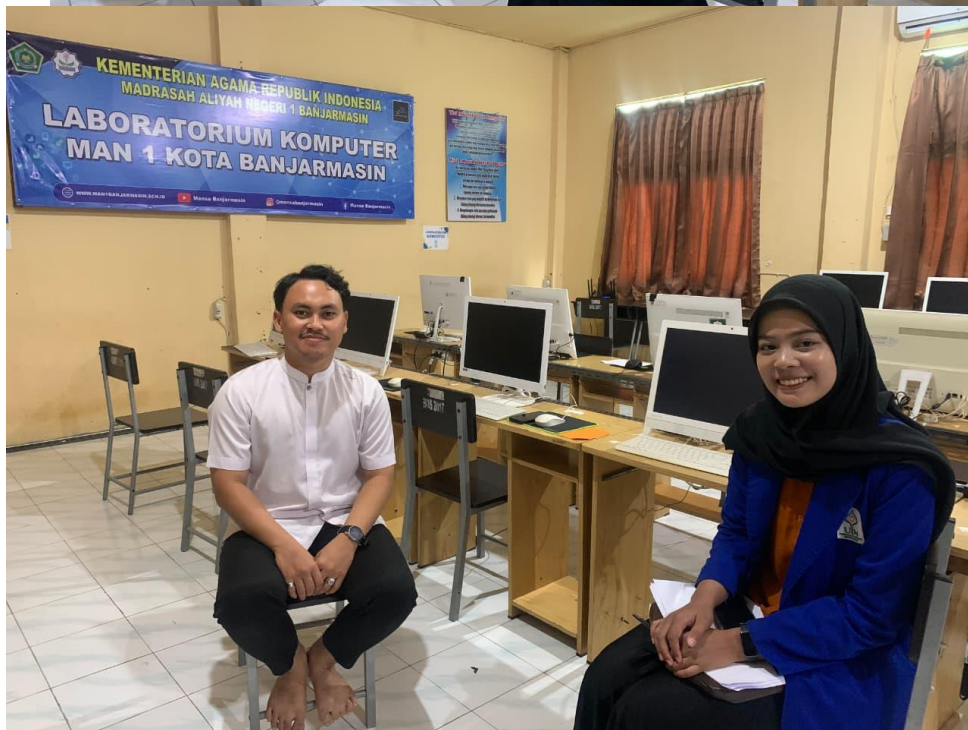
Gambar 9 Wawancara Bersama Guru TIK Sekaligus Tim IT Tabel 3 1