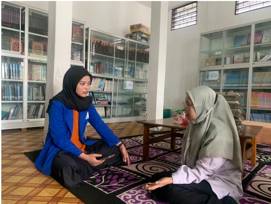
Gambar 7 Wawancara Dengan Staf Administrasi Perpustakaan