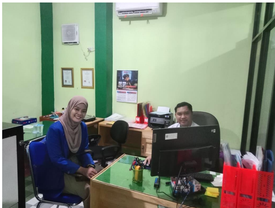
Gambar 4 Wawancara Bersama Operator Bendahara MAN 1 Banjarmasin