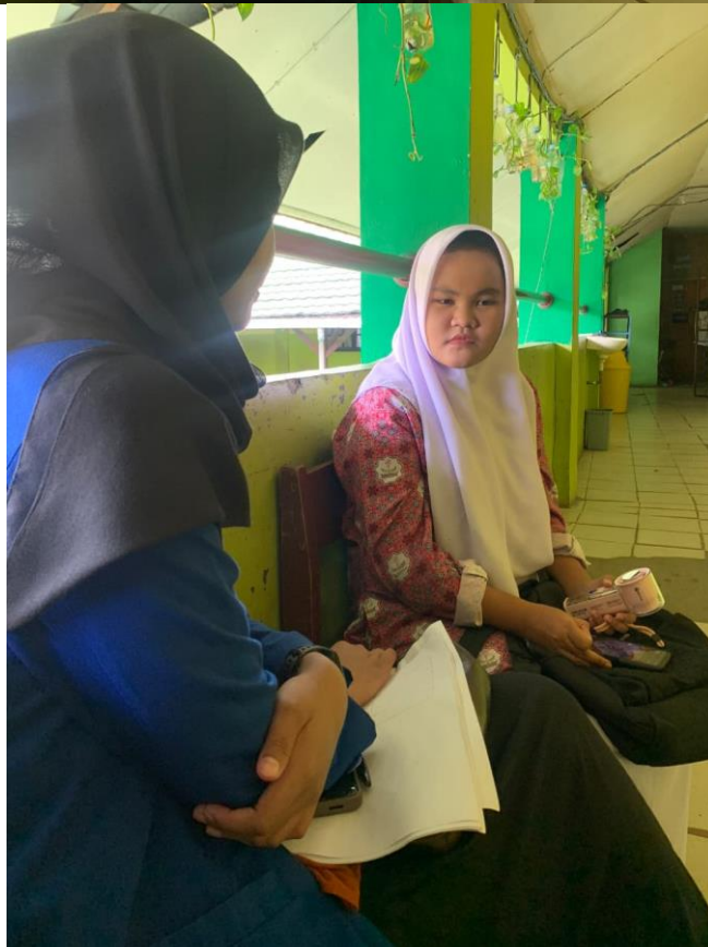
Gambar 12 Wawancara Bersama Siswa