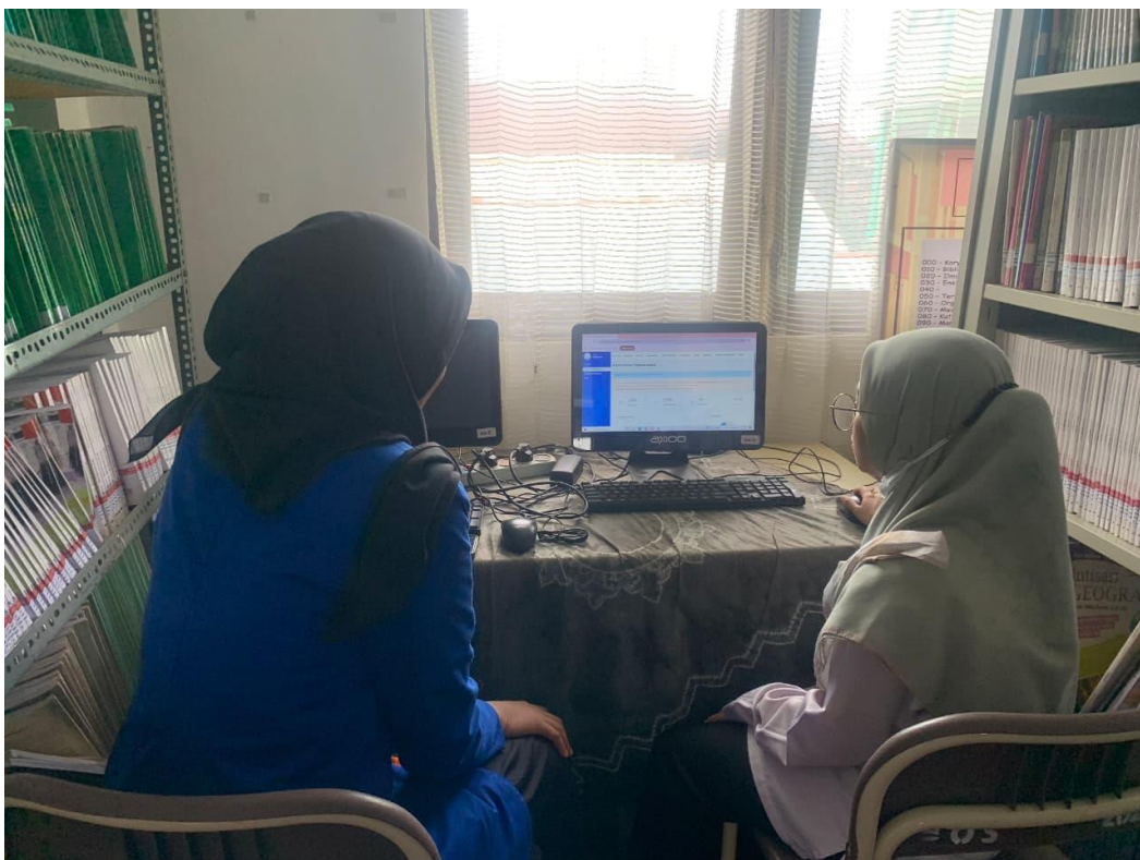
Gambar 8 Fitur Aplikasi Dengan Staf Administrasi Perpustakaan