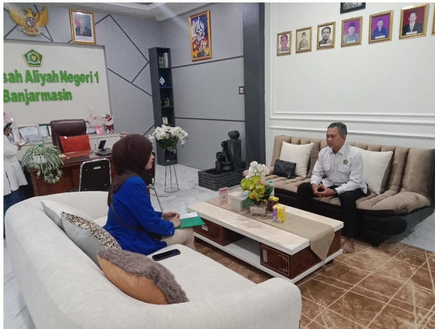
Gambar 3 Wawancara Bersama Kepala TU MAN 1 Banjarmasin