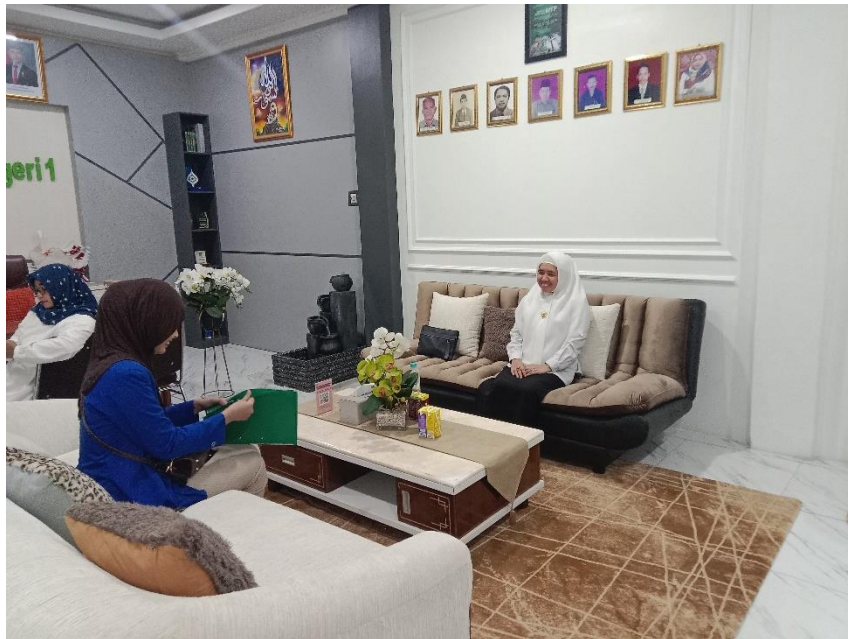
Gambar 1 Wawancara Bersama Kepala Madrasah MAN 1 Banjarmasin