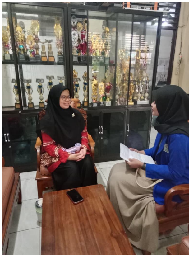
Gambar 5 Wawancara Bersama Ibu Guru