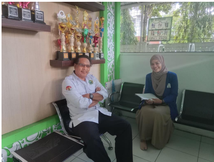
Gambar 2 Wawancara Bersama Wakamad Kurikulum MAN 1 Banjarmasin