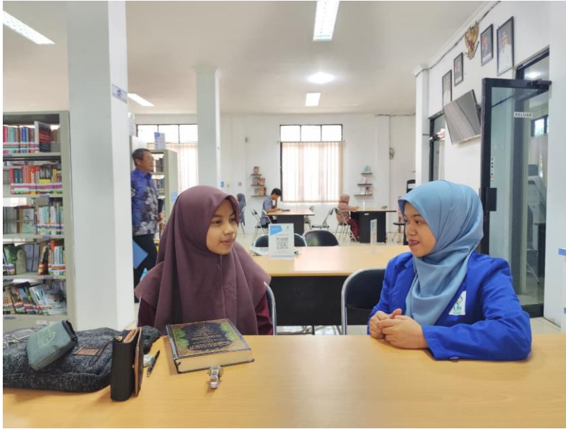
Wawancara bersama informan 1