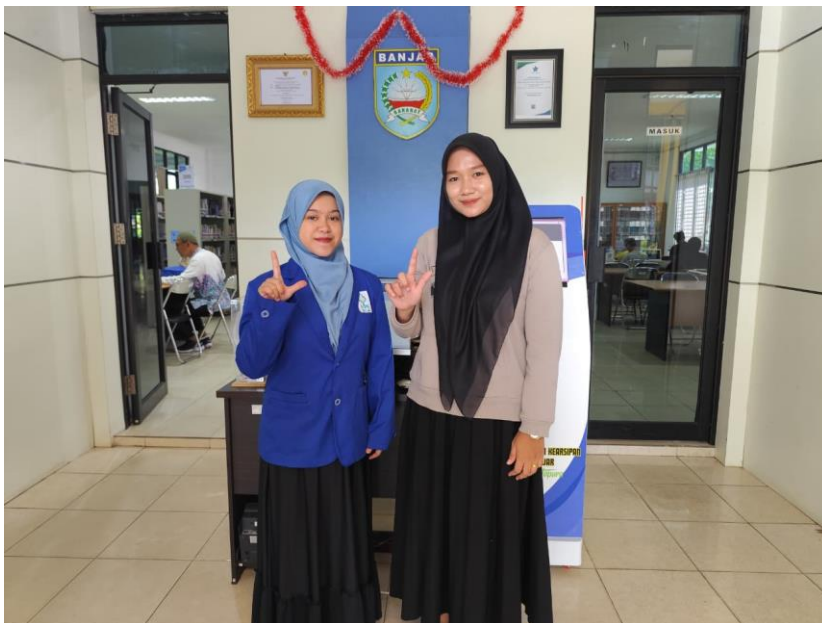
Foto bersama dengan pustakawan