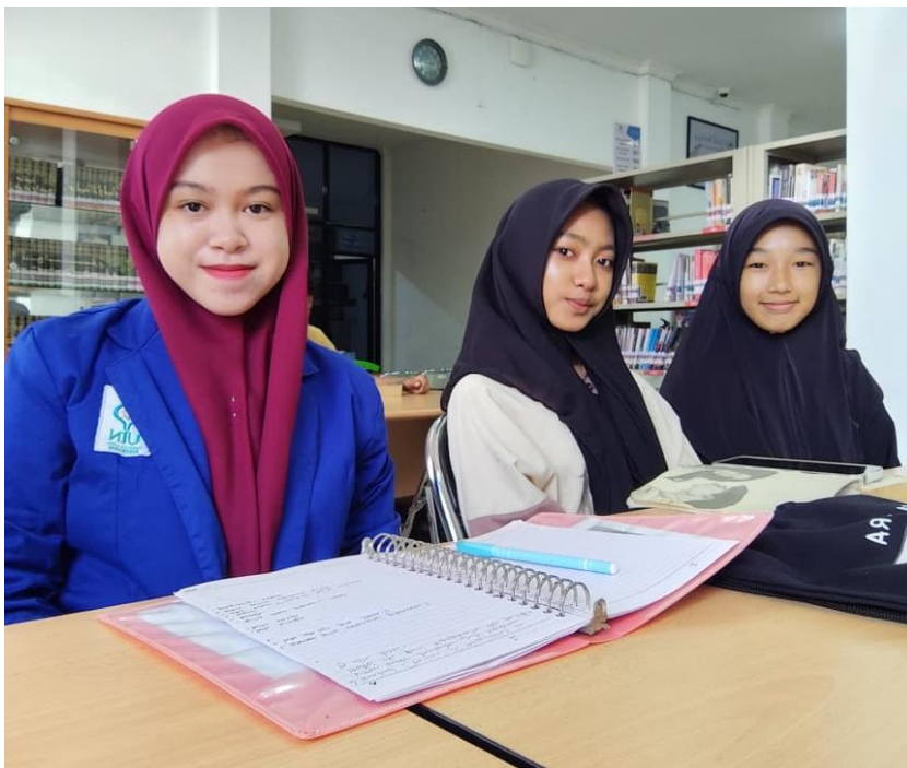
Wawancara bersama informan 5 dan 6