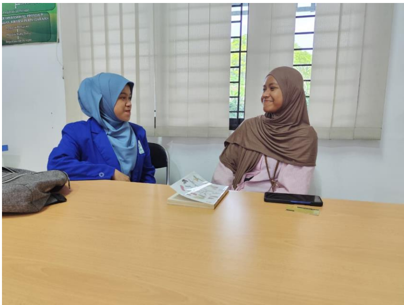
Wawancara bersama informan 2