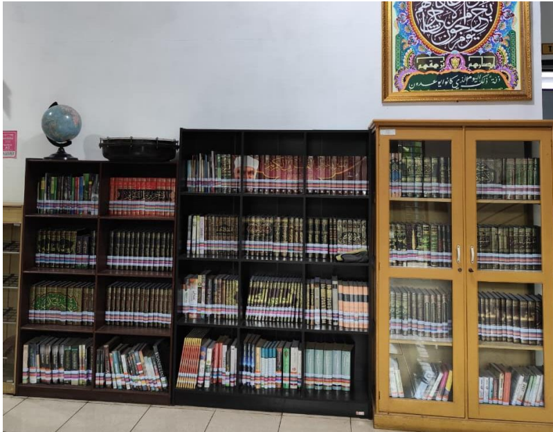
Tempat rak koleksi islami