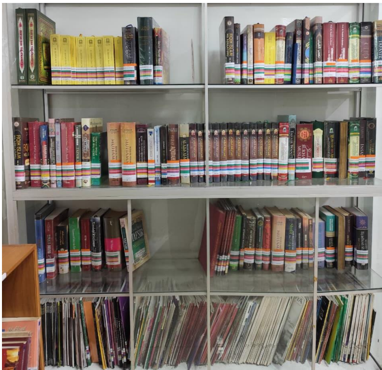
Tempat rak koleksi islami