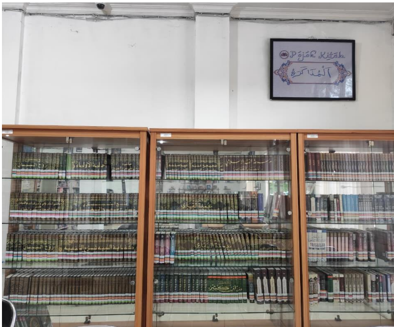
Tempat pojok kitab