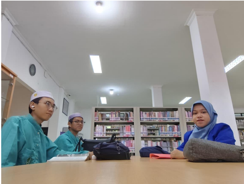
Wawancara bersama informan 3 dan 4