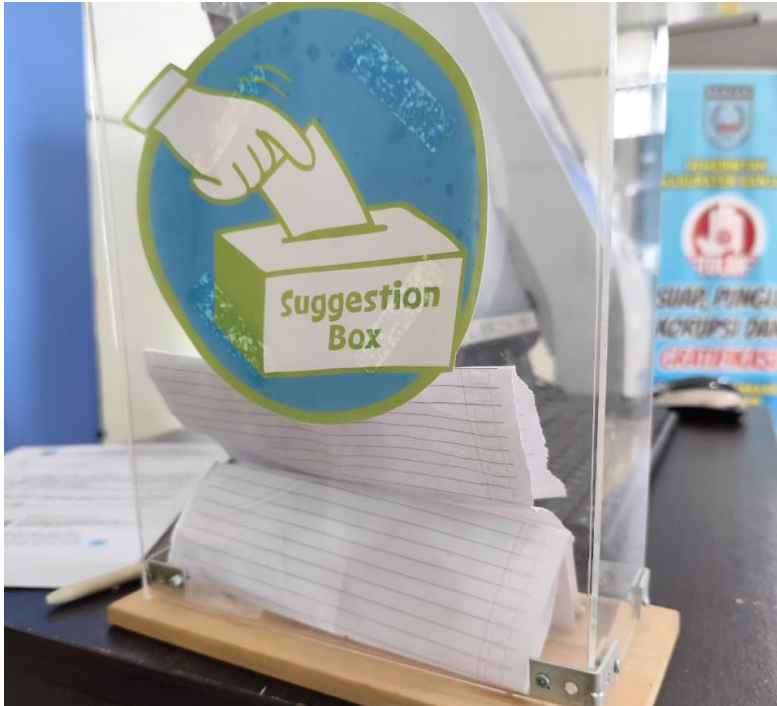
Tempat kotak saran