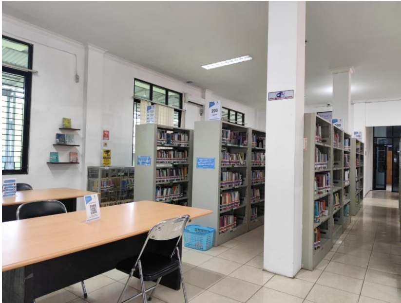
Suasana tempat membaca di perpustakaan