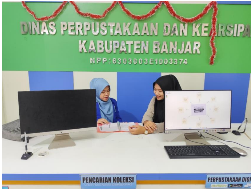
Wawancara bersama pustakawan