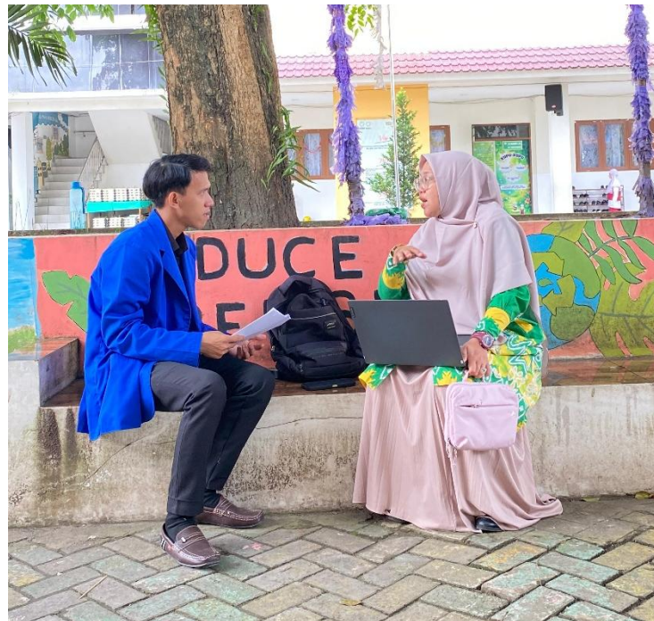
Wawancara dengan Guru SDIT Ukhuwah Banjarmasin