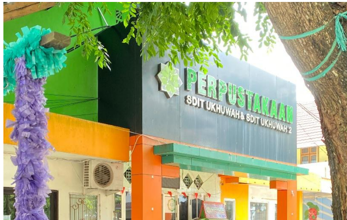
Perpustakaan Sekolah SDIT Ukuwah & SDIT Ukuwah 2