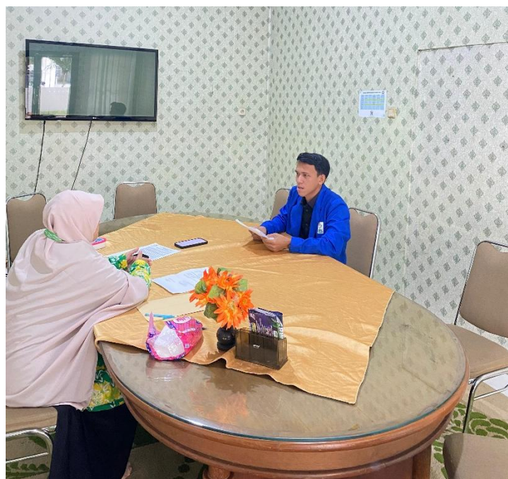
Wawancara dengan Wakil Kepala Sekolah SDIT Ukhuwah Banjarmasin