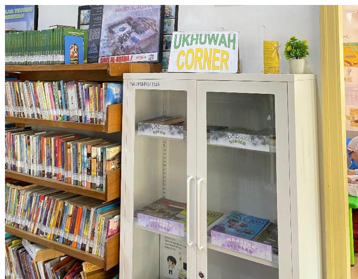
Koleksi Buku Ukhuwah Corner