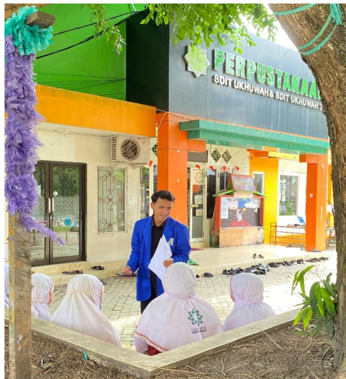
Wawancara dengan Siswa SDIT Ukuwah Banjarmasin