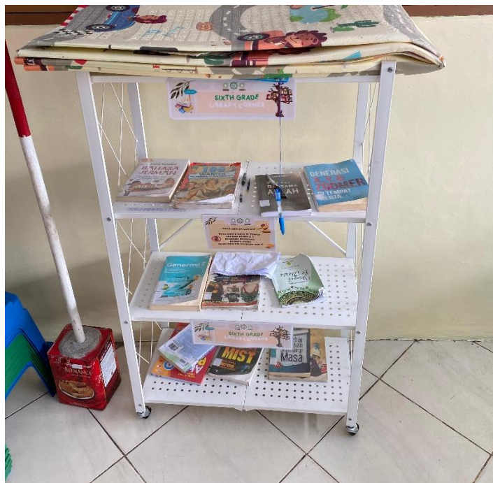
Rak Baca di Koridor