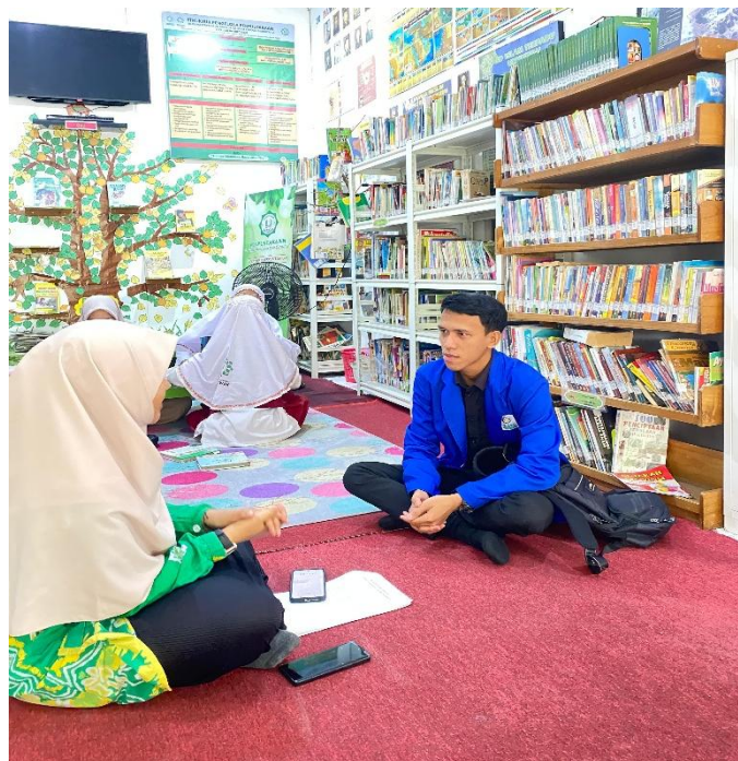
Wawancara dengan Kepala Perpustakaan SDIT Ukhuwah Banjarmasin