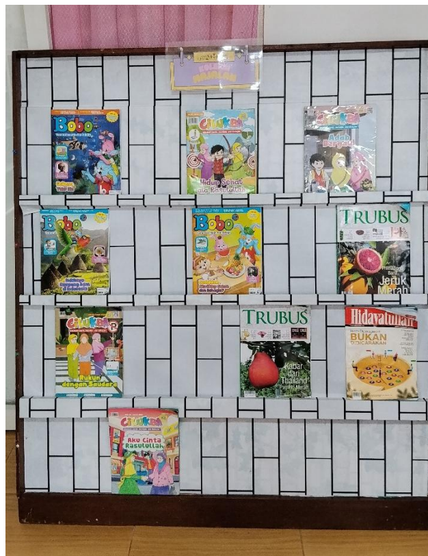
Koleksi Buku Majalah