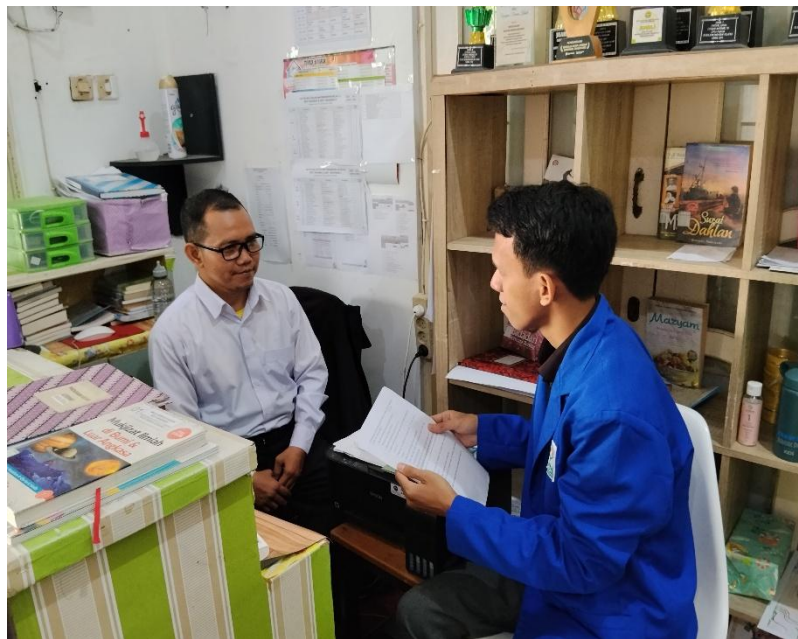
Wawancara dengan Pustakawan SDIT Ukhuwah Banjarmasin