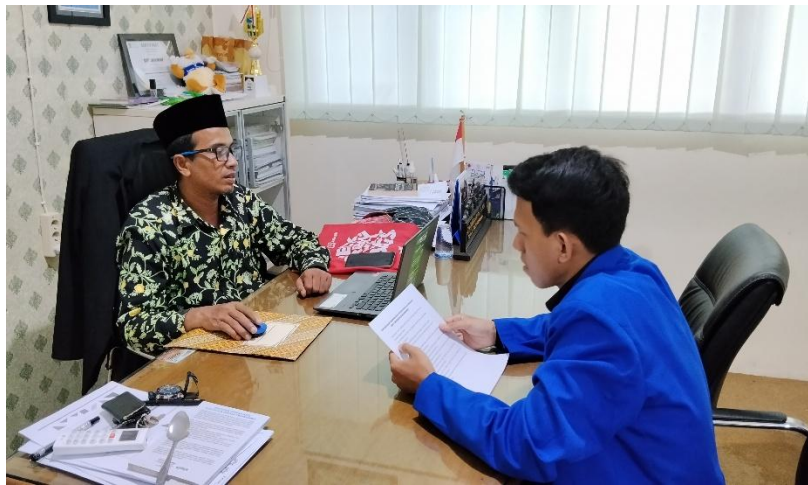
Wawancara dengan Kepala Sekolah SDIT Ukhuwah Banjarmasin