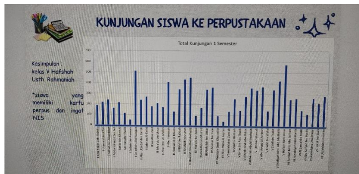
Gambar 4.6 Data Kunjungan Siswa ke Perpustakaan

Hasil wawancara tersebut diperkuat dengan data dokumentasi kegiatan literasi dan perpustakaan sekolah sebagai berikut: