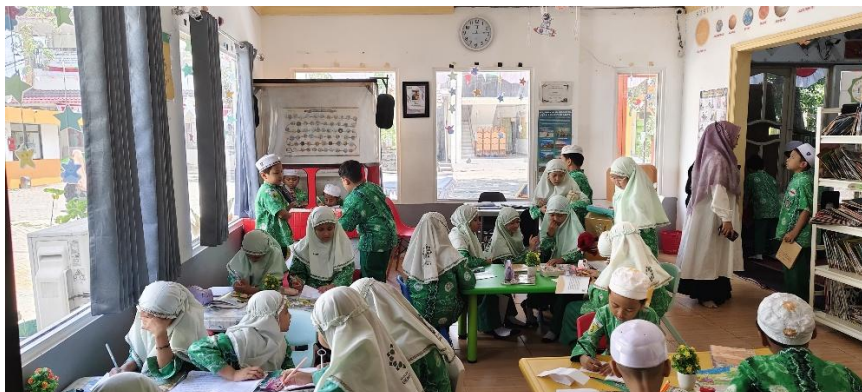
Gambar 4.2 Program Literasi Sasisaku