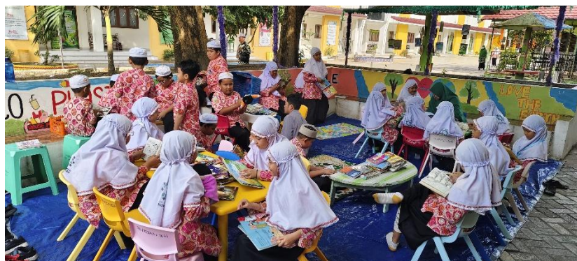
Gambar 4.5 Program Literasi Outdoor Library

Program ini melibatkan berbagai pihak, diantaranya wali kelas pendamping kelas yang bertugas mengawasi kegiatan siswa, serta petugas perpustakaan yang mengelola pelaksanaan program. Jumlah siswa yang mengikuti kegiatan ini bersifat fleksibel, tergantung pada jadwal dan kondisi di lapangan. Sarana dan prasarana digunakan dalam program ini meliputi buku bacaan, meja, serta terpal yang digunakan sebagai alas untuk kegiatan membaca di luar ruangan. Program ini dilaksanakan secara rutin sesuai jadwal yang telah ditentukan. Program Outdoor Library juga bagian dari Gerakan Literasi Sekolah (GLS) yang bertujuan untuk menumbuhkan budaya membaca di kalangan siswa. Respon siswa terhadap program ini tergolong baik, yang ditunjukkan melalui antusiasme siswa dalam mengikuti kegiatan membaca di luar ruangan.