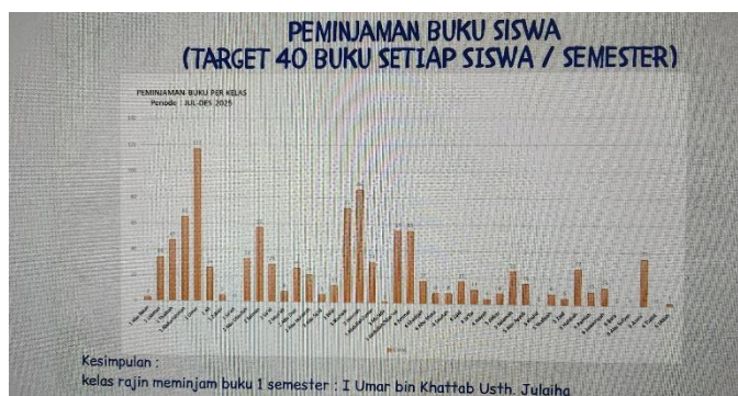
Gambar 4.7 Data Peminjaman Buku di Perpustakaan

Berdasarkan data dokumentasi kunjungan perpustakaan selama satu semester, terlihat bahwa siswa cukup aktif memanfaatkan fasilitas perpustakaan sekolah. Kelas V Hafshah menjadi kelas dengan tingkat kunjungan tertinggi. Data tersebut menunjukkan bahwa program literasi mampu meningkatkan keterlibatan siswa dalam memanfaatkan perpustakaan sebagai sumber belajar. Selain data kunjungan perpustakaan aktivitas siswa juga dapat dilihat melalui data peminjaman buku di perpustakaan sekolah.