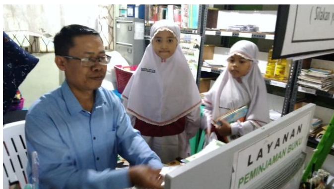
Gambar 4.3 Program Literasi Reading and Borrow

Sarana dan prasarana yang digunakan dalam program ini meliputi koleksi buku bacaan, meja, kursi, serta alat tulis yang mendukung kegiatan literasi siswa. Program ini dilaksanakan secara rutin dan berkelanjutan. Program reading and borrow juga bagian dari Gerakan Literasi Sekolah (GLS) yang bertujuan untuk menumbuhkan budaya membaca dikalangan siswa. Respon siswa terhadap program ini tergolong baik, yang ditunjukkan melalui antusiasme siswa dalam membaca, meminjam buku, serta berkunjung ke perpustakaan. Selain itu pihak perpustakaan juga memberikan hadiah kepada siswa yang aktif dalam kegiatan literasi sebagai bentuk motivasi.