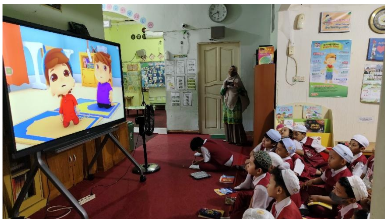
Gambar 4.4 Program Literasi Nobar Celi

Program Nobar celi dilaksanakan di perpustakaan sekolah sesuai jadwal yang telah ditentukan. Dalam pelaksanaannya siswa menonton tayangan edukatif seperti kartun pendidikan atau film bertema tertentu, misalnya film yang berkaitan dengan peringatan hari tertentu. Kegiatan ini berlangsung selama kurang lebih 15-20 menit. Selain menonton, siswa juga diarahkan untuk meresume dari tayangan yang telah ditonton, meskipun dalam pelaksanaannya dapat disesuaikan dengan kebijakan wali kelas. Pelaksanaan program Nobar Celi dapat dilihat pada gambar berikut: