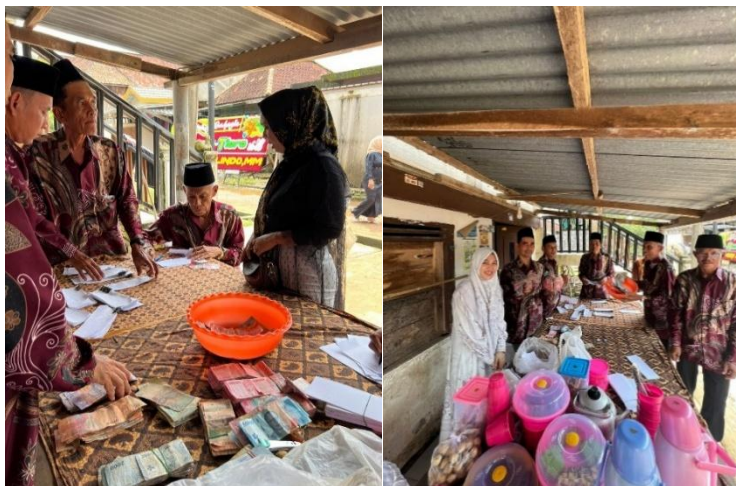
(Masyarakat menyerahkan uang ke Panitia Kelap untuk ngambek ari , Januari 2026)

Oleh karena itu, pada hakikatnya sumbangan yang diberikan merupakan penyetaraan dari nilai padi, sehingga meskipun diwujudkan dalam bentuk uang, secara substansial sumbangan tersebut dipahami sebagai komoditas padi yang diaplikasikan dalam bentuk pembayaran tunai. Sejalan dengan pemahaman tersebut, pencatatan sumbangan tidak menggunakan nominal uang, melainkan tetap dicatat dalam satuan kaleng sebagai representasi nilai komoditas padi.