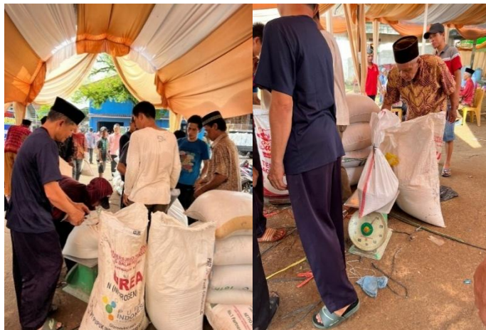
(Masyarakat menyerahkan beras dan ditimbang oleh warga, Januari 2026)

Sama halnya dengan ngambek ari bolu , pada pelaksanaan ngambek ari beras masyarakat juga melakukan penyerahan beras melalui panitia kelap , namun untuk pengecekan atau penimbangan beras biasanya dilakukan oleh pihak warga lain bersama keluarga pengantin yang ikut membantu mengecek atau mengawasi.