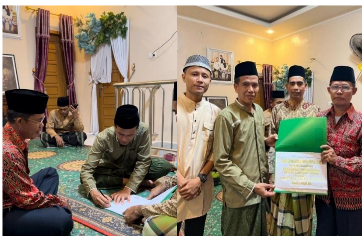
(Dokumentasi saat penyerahan catatan ngambek ari ( serah gawe ))

Selesai acara ado yang namonyo serah gawe, catatan tadi diserahkan oleh panitia ke pihak keluarga yang ngadoke hajatan sebagai laporan. Kage ditandatangani sebagai komitmen nak mbalekke lagi sumbangan itu. (Setelah acara selesai, terdapat tahap yang disebut serah gawe, di mana catatan sumbangan diserahkan oleh panitia kepada keluarga yang menyelenggarakan pernikahan sebagai laporan. Catatan tersebut kemudian ditandatangani sebagai bentuk komitmen untuk mengembalikan sumbangan tersebut di kemudian hari). 128