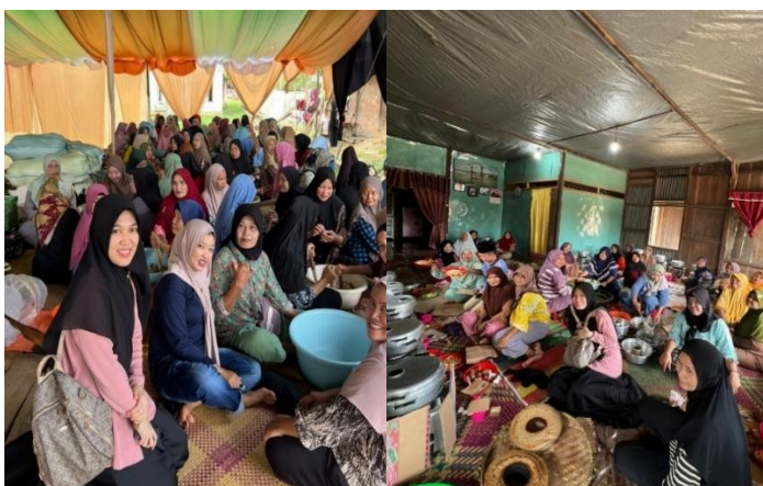
(Masyarakat membuat bolu saat ngambek ari , Januari 2026)

Raso solidaritas (kepedulian) antar warga biso diliat dari bantuan tenaga yang diberikan sejak awal ngambek ari bolu sampe beras, mulai dari buat bolu, masak/ngocek bawang, sampe selesai acaro. Semuo itu dilakoke secara gotong royong oleh masyarakat semato-mato untuk mensukseskan acaro yang diadoke oleh yang punyo hajatan. (Rasa solidaritas atau kepedulian antarwarga dapat dilihat dari kontribusi tenaga yang diberikan sejak awal pelaksanaan ngambek ari bolu hingga beras, mulai dari pembuatan bolu, memasak, sampai selesai acara. Seluruh kegiatan tersebut dilakukan secara gotong royong oleh masyarakat semata-mata untuk menyukseskan acara yang diselenggarakan oleh pemilik hajatan). 132