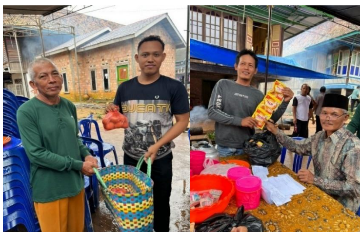
(Masyarakat menyerahkan bahan bolu untuk ngambek ari , Januari 2026)

Hal ini menunjukkan bahwa pengembalian sumbangan tidak harus dilakukan dalam bentuk barang yang sama, selama nilainya setara dengan nilai barang yang menjadi kewajiban berdasarkan harga yang berlaku saat itu. Meskipun mayoritas masyarakat tetap melunasinya dalam bentuk barang, fleksibilitas ini mencerminkan kemudahan yang telah disepakati bersama.