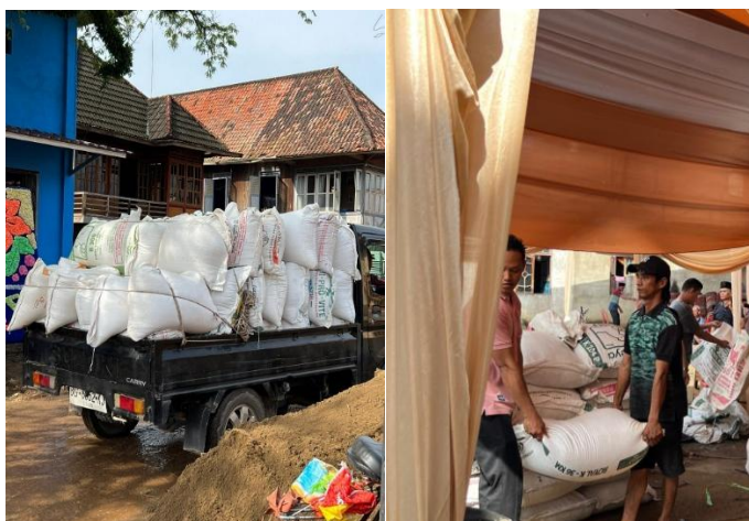
Dokumentasi pengantaran beras ke penjual)

Selanjutnya beras yang sudah dikumpulkan kemudian dibantu warga untuk diantarkan kepada penjual yang akan membeli langsung beras tersebut. dan hasilnya nanti akan diserahkan kembali kepada tuan gawe .