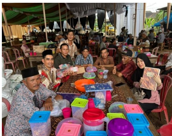
(Panitia Kelap melakukan pencatatan, Januari 2026)

Berdasarkan hal tersebut, dapat dipahami bahwa tradisi ngambek ari mencerminkan adanya kepercayaan masyarakat yang terus terjaga dari generasi ke generasi. Kepercayaan ini tidak hanya terlihat dari keyakinan masyarakat terhadap panitia kelap , tetapi juga menunjukkan kuatnya relasi sosial berbasis saling percaya yang menjadi fondasi dalam menjaga keberlangsungan praktik tersebut.