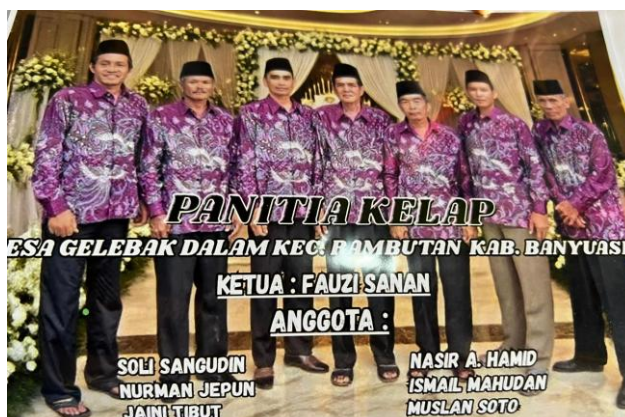
(Panitia Kelap terbaru pada saat pelaksanaan ngambek ari , Januari 2026)

masuk. Panitia ini bertugas mencatat setiap sumbangan secara rinci, meliputi jenis sumbangan, jumlah, serta identitas pemberi. Pencatatan tersebut menjadi aspek krusial karena berfungsi sebagai dasar pengembalian di masa mendatang.